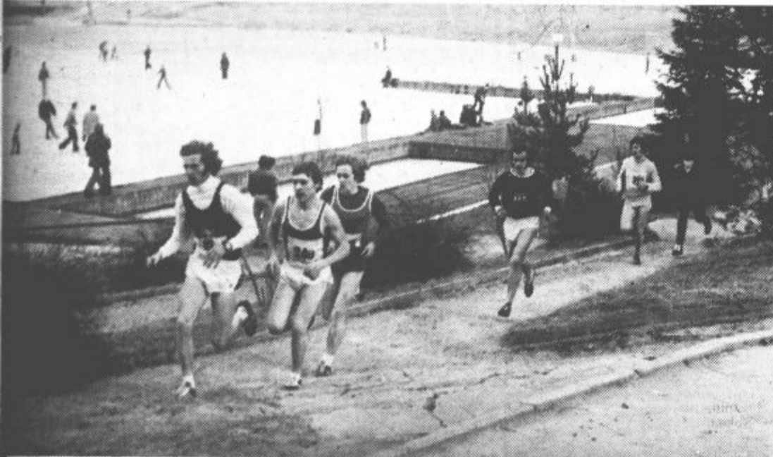
Tekači ob zamrznjenem velenjskem jezeru na nedeljskem zimskem krosu.