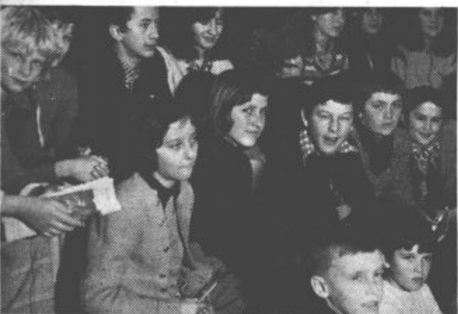
Pionirji z osnovne šole Miha Pintar Toledo