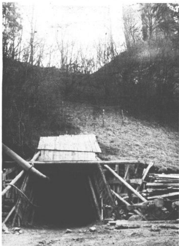
Začetek raziskovalnega rova. Seveda bo predor veliko večji, tako da bo skozenj možen dvosmerni promet.

Je teren trd za vrtanje? „Prvih 40 metrov je bil apnenec, le vmes je bil od desetega do petindvajsetega metra nekompaten teren. Zato smo morali na tem delu predora vse delati na zatik, ki je zahteval tudi več podpornega materiala. Tudi sedaj, ko gre vrtanje raziskovalnega predora h koncu, bomo morali delati veliko bolj previdno, ker bomo morali paziti, da ne poškodujemo objektov.“