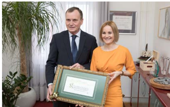
Na sprejemu v mestni hiši

Neudauer je vodenje knjižnice prevzel leta 2006 in s sodelavci načrtoval vizijo razvoja in delovanja knjižnice. Spodbujal in podpiral je razvoj domoznanske dejavnosti, ki ima na Ptujskem dolgo tradicijo. V času njegovega vodenja je bilo zaključenih