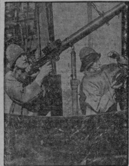
Angleški ribiški čolni so oboroženi s strojnimi in topovi