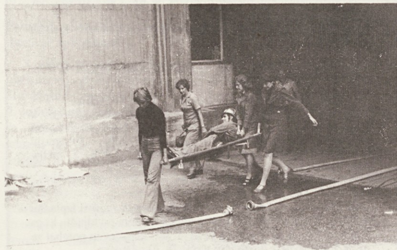
Vaja reševanja ponesrečenecv

Vsaka od teh variant ima v sebi določene prednosti, žal pa tudi pomanjkljivosti. Vendar pa bomo rešitev morali poiskati v eni izmed teh variant ali pa kombinaciji vseh treh. Sicer pa tudi dosedanja stroški za lasten razvoz niso bili majhni, saj moramo našim šoferjem plačevati nadure, podjetje pa se izpostavlja, ker dopušča tolikšno preobremenjenost delavcev, ki je nevarna tudi za njihovo zdravje.