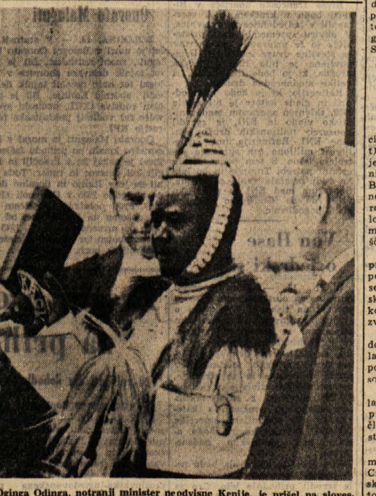
Oginga Odinga, notranji minister neodvisne Kenije, je prišel na slovensko proglasitve neodvisnosti in tradicionalni narodni noši svoje dežele

Generalni sekretar mednarodnega filmskega festivala v Cannesu je izjavil, da bo prihodnji festival od 29. aprila do 13. maja 1964. leta in da bo potekal po novem pravilniku. Tako bodo potabili le 22 držav, ostale države, ki imajo diplomatske odnose s Francijo bodo pozvali, da predložijo festivalnemu komiteju svoje filme, ki morajo biti najboljši filmi leta teh držav. Poseben komite bo izbral med temi filmi najboljši in leti bodo lahko potlej enakopravno konkurirali s filmi iz 22 uradno pozabljenih držav. Kar zadeva nagrade, bodo prihajne leto podelili samo »Grand prix«, specialno nagrado žirije in dve nagradi za igro. Za veliko festivalno nagrado bodo konkurirali vsi tako tudi kratkometražni filmi, ki jim namenjajo še eno nagrado žirije. Najboljša nagrada canskega festivala tako ne bo več »Zlata palma«, temveč »Grand prix«.