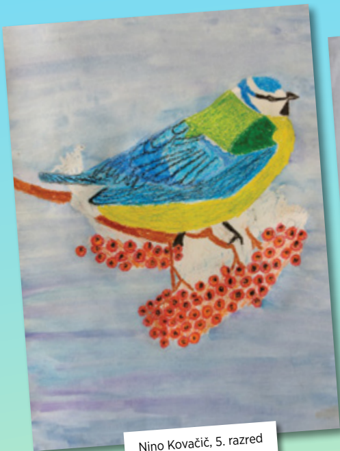
Nino Kovačič, 5. razred