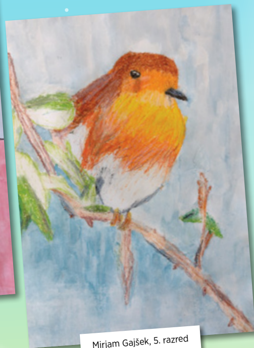
Mirjam Gajšek, 5. razred