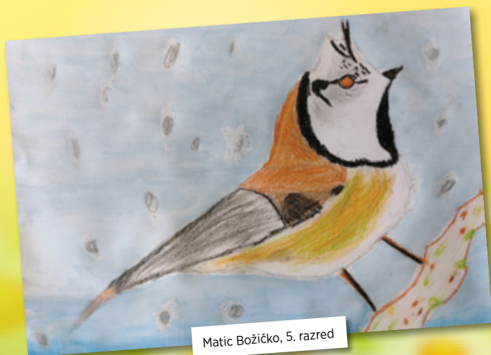
Matic Božičko, 5. razred