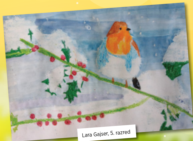
Lara Gajser, 5. razred