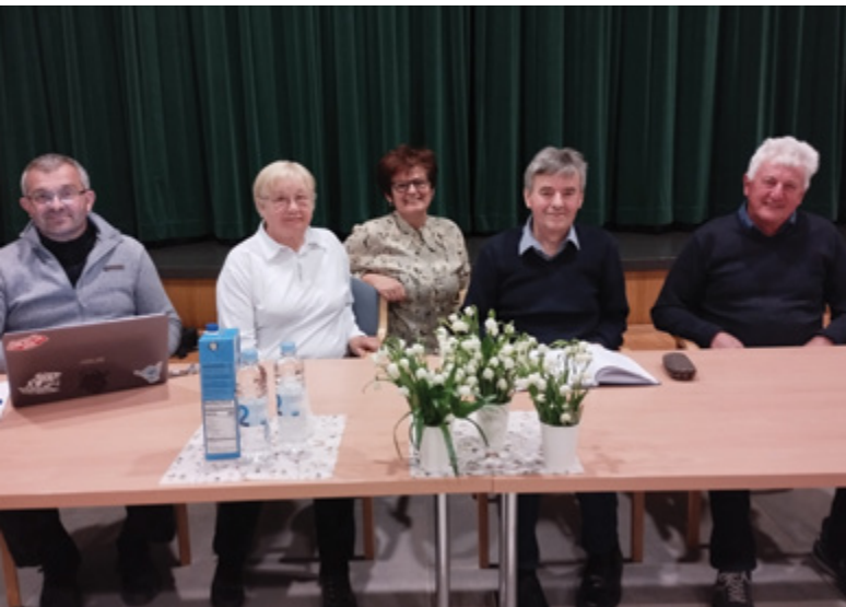
Delovno predsedstvo Občnega zbora Kulturnega društva Žetale