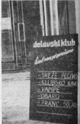
DELAVSKI KLUB, danes vam priporočamo