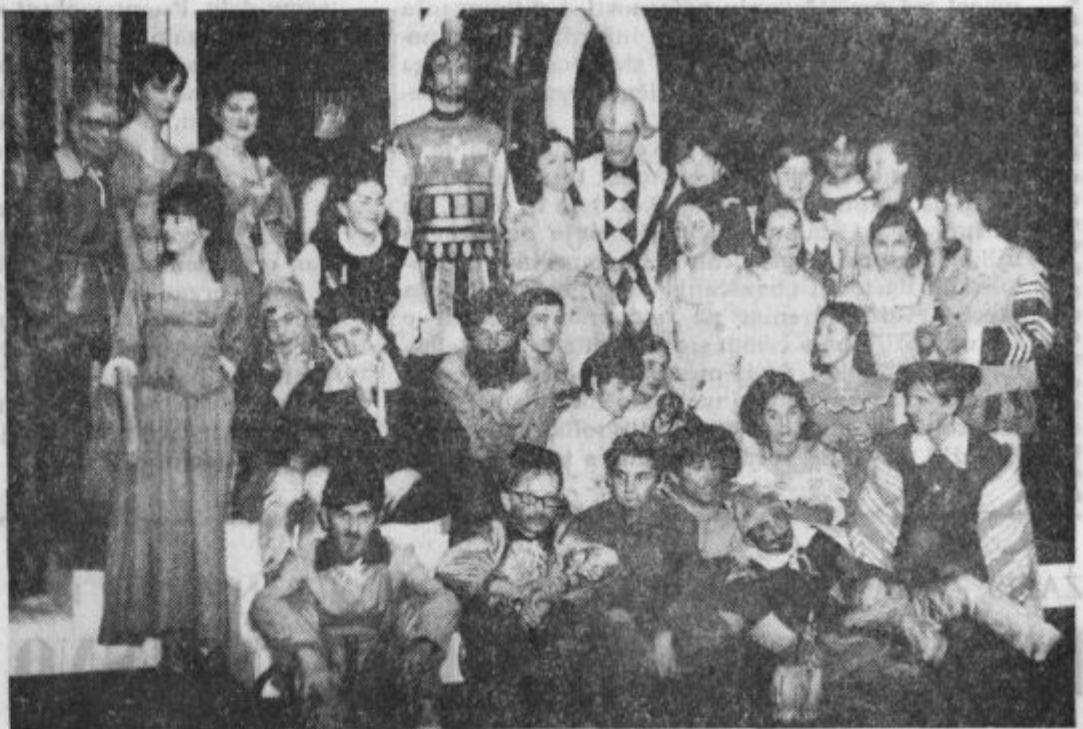
Za uspešen zaključek še posnetek — tokrat po gasilsko

Vsem prirediteljem in izvajalcem se v imenu naših malih iskreno zahvaljujemo za prijetno novoletno doživetje. M. M.