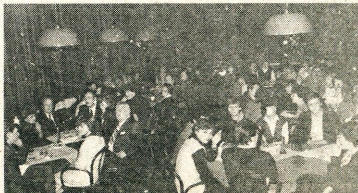
Preurejen SLAMNIK nudi veliko večjo ponudbo; v bolj kulturnem okolju so poskrbeli tudi za disko glasbo

V SLAMNIKU nameravajo pripraviti tudi plesne tečaje, sprva za mlade z osnovnih šol, kasneje pa če se bo obneslo tudi za starejše. V povezavi z občinsko konferenco ZSMS bodo te plesne vaje stekle že s 1. februarjem, predvidevajo pa, da bodo v okviru nedeljske ponudbe zmogli ponuditi tudi druge oblike v drugih dneh tedna. Idej za popestritev plesne ponudbe v domžalskem Slamniku ne manjka, zato predvidevamo, da smo v Slamniku, ki ostaja klasična restavracija, pridobili kulturni objekt, kjer naj bi v večernih urah občani imeli priložnost na kulturnen način obogatiti svoje proste ure.