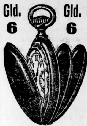
Križanska trdka. Ustanovljena l. 1860.

Gld. 6 Nedosežno po svoji lepoti in natančnosti so moje pristne švicarske briljantne črne jeklene