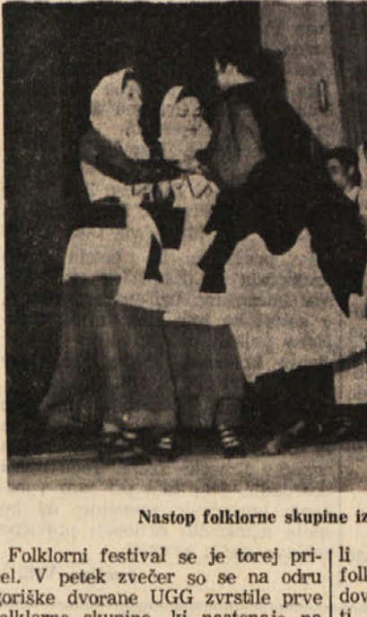
Nastop folklorne skupine iz Norua na Sardiniji

V petek in včeraj kar trije raznih skupin - Pozdrav goriskega župana Danes popoldne mimohod po mestu, zvečer zaključna prireditev