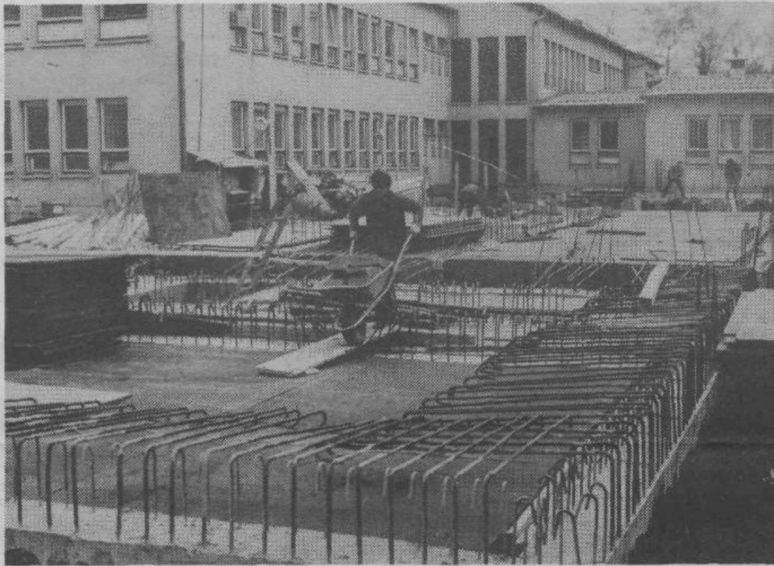
Pred poldrugim mesecem je bil položen temeljni kamen.