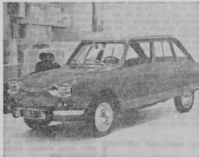
Bolj elegantni ami-3 bo prav tudi pri nas: prostornina na 100 km in 123 km na uro.

Otvoritev salona je bila 13. marca t. l. Veliki razstavljeni prostor je pod streho. Poleg velikega števila avtomobilov vseh vrst in firm so razstavljeni tudi motorni člani, jadralnice, jahte, kolesa, motorna kolesa in najrazličnejša avtomobilska oprema. Jože Galun pravi, da je bil navdušen, skoraj očaran nad lepo aranžirano in opremljeno razstavo. Na lepih preprogah so se bleščali najnovejši tipi avtomobilov, različnih firm iz