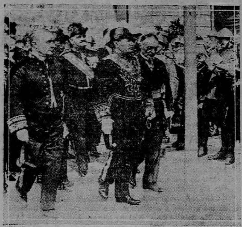
Pred kratkim je obiskal italijanski diktator Mussolini pristaniško mesto Genova. Pri tej priliki je seveda nosil — admiralsko uniformo.