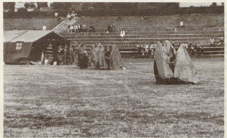
Vaja je dobro uspela