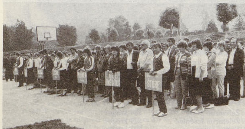
Udeleženci na letnih športnih igrah na štorskem stadionu