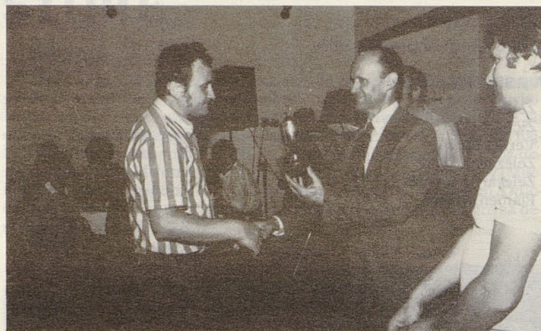
Zaključek športnih iger v Domu železarjev