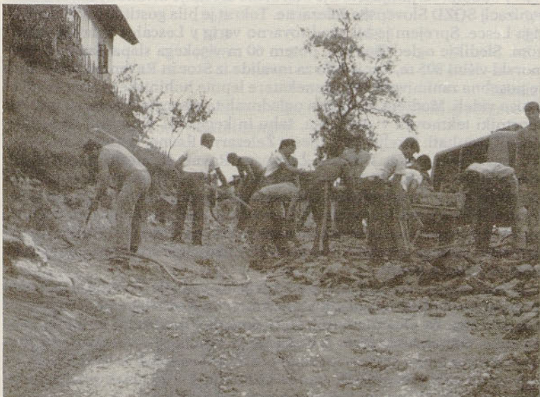
Krajanji Straže na eni od mnogih akcij svoje ceste

Ocena vaje, ki so jo povedali strokovni ljudje na skupni seji s člani štaba neposredno po končani vaji, je bila ugodna. Pohvala za uspeh velja tudi krajanom naselja, sodelujočim pripadnikom CZ in komitejema za SLO – DS v KS in železarni.