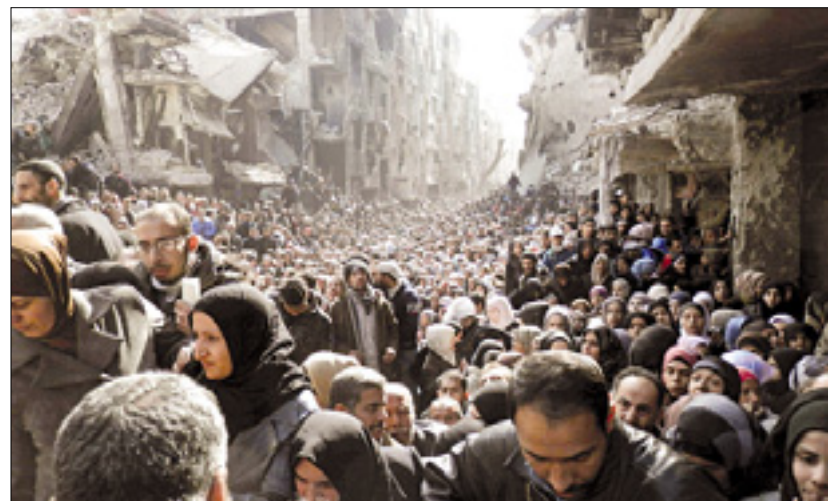
Ogromna množica palestinskih beguncev v taborišču Jarmuk

IS je zavzela široka ozemlja na vzhodu Sirije ter na severu in zahodu Iraka in tam oklicala kalifat. V Siriji se bori tako proti Asadovemu režimu kot proti zmernejšim upornikom. V Jarmuk naj bi pripadniki IS vdrl iz sosednjega predmestja Damaska Hadžar Asvad.