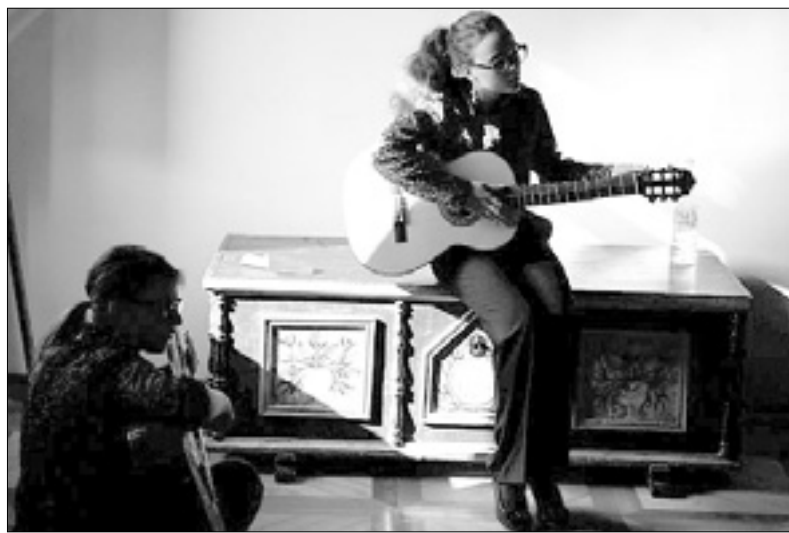
Na tekmovanju Svirel

Sklepni del dogajanja v sekciji godal in brenkal bo danes, 2. aprila, ob 18. uri na gradu Dobrovo. Tam se bo na finalnem koncertu pred strokovno žirijo predstavilo več izbranih solistov in dve komorni skupini, ki jim je žirija prisodila najvišje ocene zaradi prepričljive izvedbe na tekmovanju. Potegovali se bodo za absolutno nagrado, ki jo bodo podelili solistu godal, solistu brenkal in eni komorni skupini. Kot poseben gost se bo na finalnem koncertu predstavil Ansambel rogov HoRORn