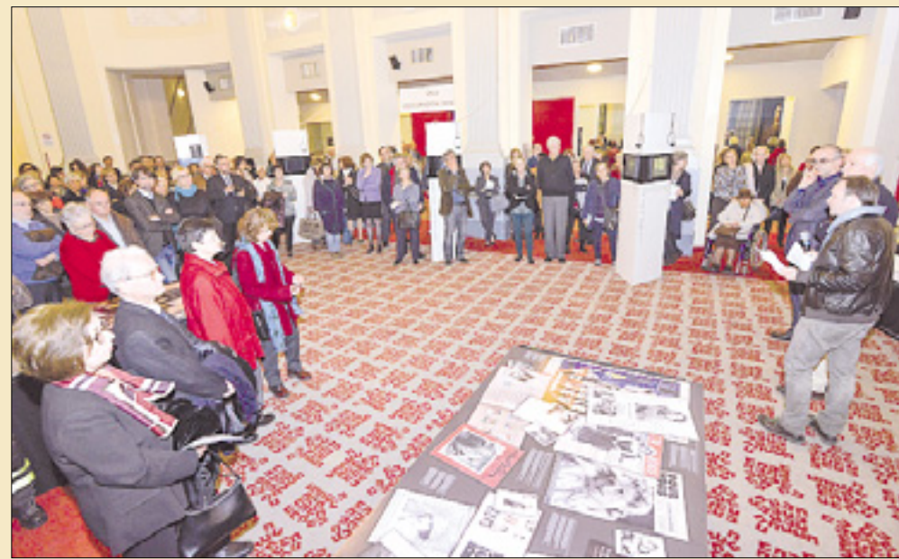
Razstavo so odprli v Gassmanovem foajeju

Kinoatlejeva razstava bo na ogled do 19. aprila - V četrtek, 9. aprila, srečanje o slovenskih igralcih v Hollywoodu