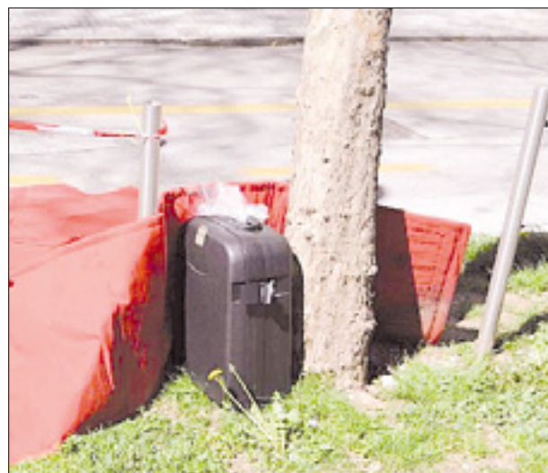
Sumljivi kovček (zgoraj), pirotehnik na delu in zapora (spodaj)

Po razstrelitvi so nemudoma odpravili zaporo ceste in preklkali prepoved mimohoda, črni kovček pa so odnesli. Hiteli so, zato da ne bi med ljudmi povzročili pretirane vznemirjenosti, kljub temu nevarnosti niso podcenjevali, pa čeprav je do najdbe prišlo prvega aprila.