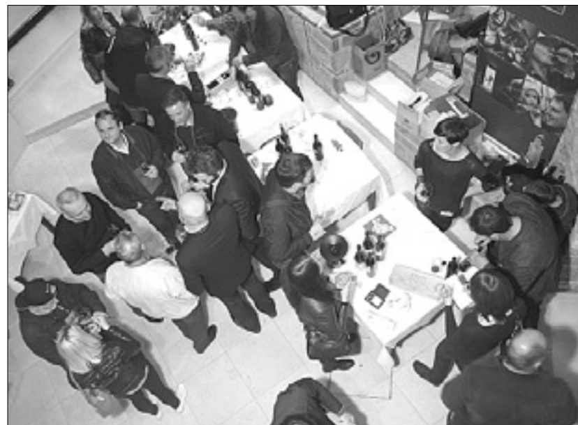
Zanimanje za svet refoška je bilo precejšnje