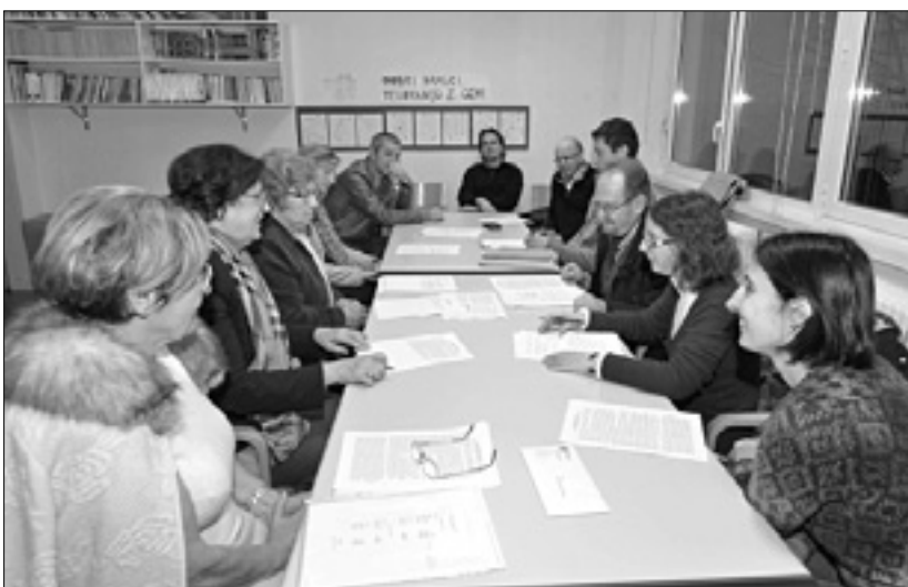
... in članice ter člani na občnem zboru Tončičevega sklada

Zanimivo je, da se je kljub povprečni pocenitvi raven cen za nabavo prehrane v enem letu najbolj povečala in sicer za 2,1 odstotka, za 1,3 odstotka pa so se povečali stroški povprečne družine za izobraževanje.