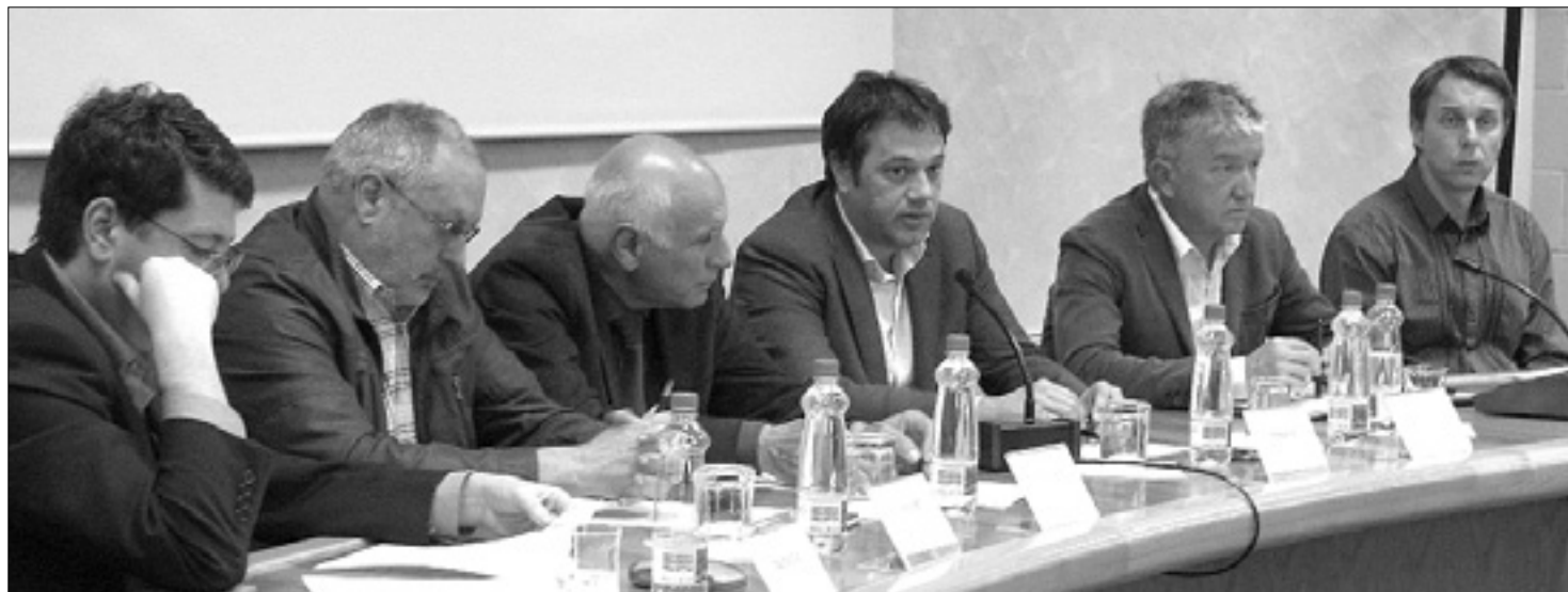
Predstavniki goriških občin in predsednik območne obrtne zbornice