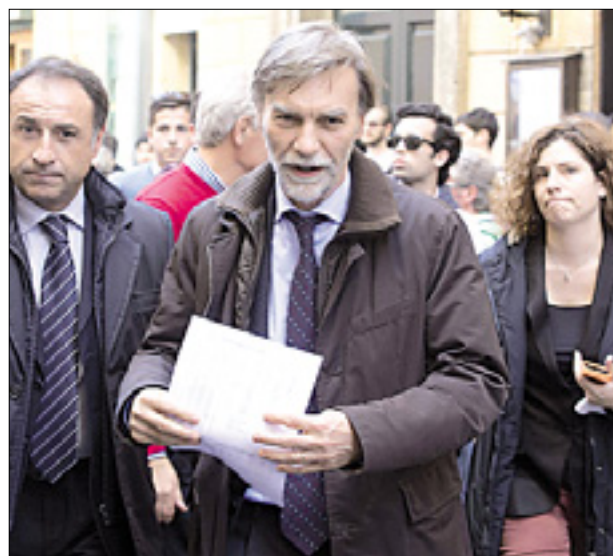
Podtajnik pri predsedstvu vlade Graziano Delrio