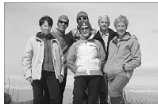
Pohodniki SPDT na Malem Golaku (1495 m)

Na velikonočni ponedeljek, to je 6. aprila, se bodo člani Slovenskega planinskega društva Trst z avtobusom podali na tradicionalni Pomladanski izlet. Sprehodili se bodo po predalpskem hribovju, ki se dviga nad Volčami, med Tolminom in Mostom na Soči. Najprej se bodo povzpeli na vzpetino Mengore, na kateri stoji cerkva sv. Marije. Področje je tesno povezano z usodo prebivalstva Tolminske in Zgornje-ga Posočja. Ob turških vdorih so domačini tu iskali