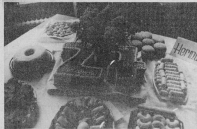
— Žene in dekleta so na razstavi kulinarčnih izdelkov predstavile tudi torto, namenjeno prazniku