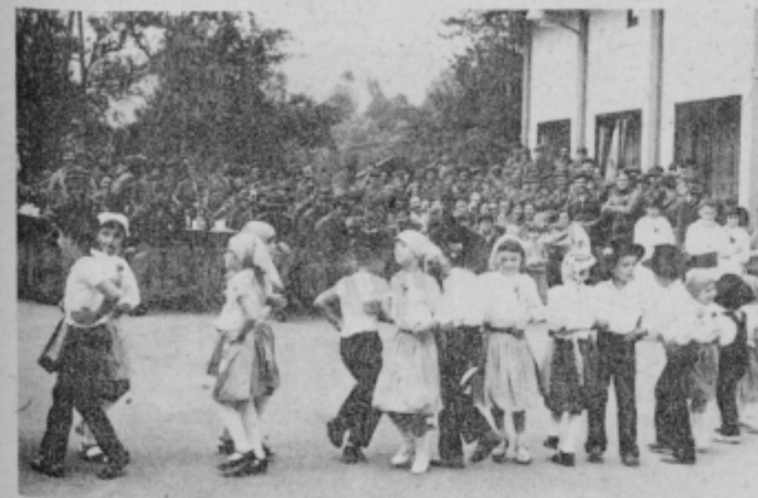
Najmlajši iz Dolene so bili ponosni, da nastopajo pred vojaki, ki so jih nagradili z gromkim ploskanjem.