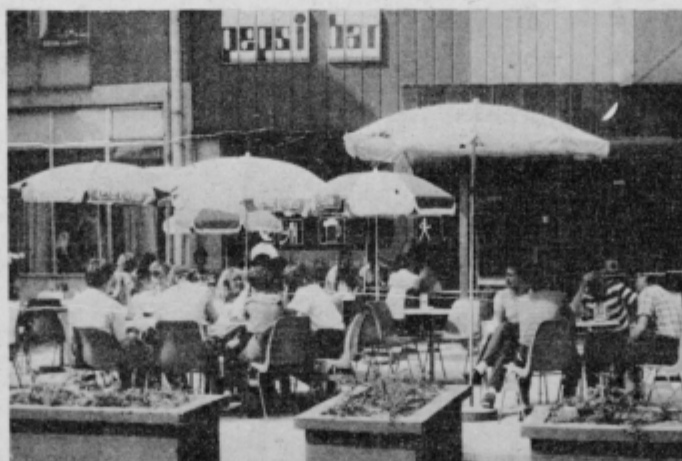
Ob sončnih dneh je vrt vedno poln gostov.