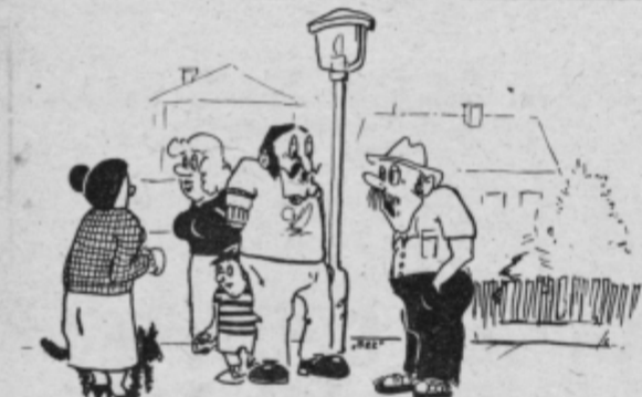
— Boste tudi vi preživel dopust doma? — Kje pa, je predrago. Mi gremo k sorodnikom.