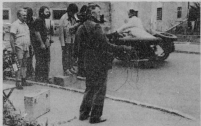
Tonsko snemanje kadra št. 207 na Prešernovi v Ptuju.