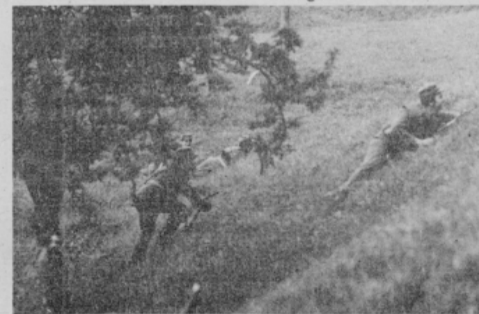
Silovito prodiranje proti desantu plavega.