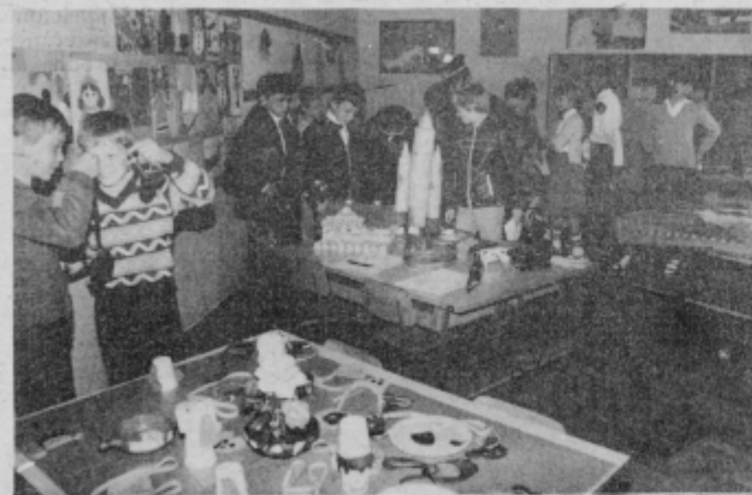
— Svoje izdelke pa so predstavili tudi učenci šole in mladi iz vrta