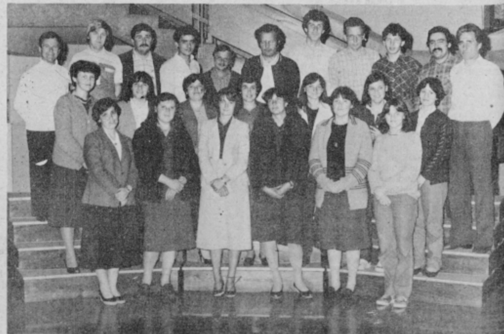
Pevke in pevci zbora v Podlehniku po eni izmed vaj.