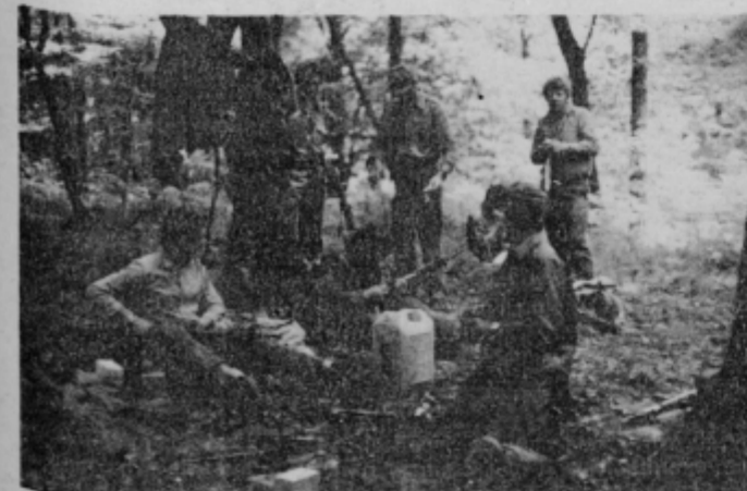
Skrb za orožje in opremo je tudi stabilizacijski ukrep.

O tej uspeli vaji smo že pisali, vendar naj ponovim, da je bil napad na »desat« tako bliskovit in organiziran, da ga ne bi vzdržal noben agresor.