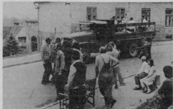
Snemanje godbenikov pred hišo na Prešernovi 35

V Ptuju so največ posnetkov napravili s prizori skupine glasbenikov na tovornjaku s spremljajočim motoristom.