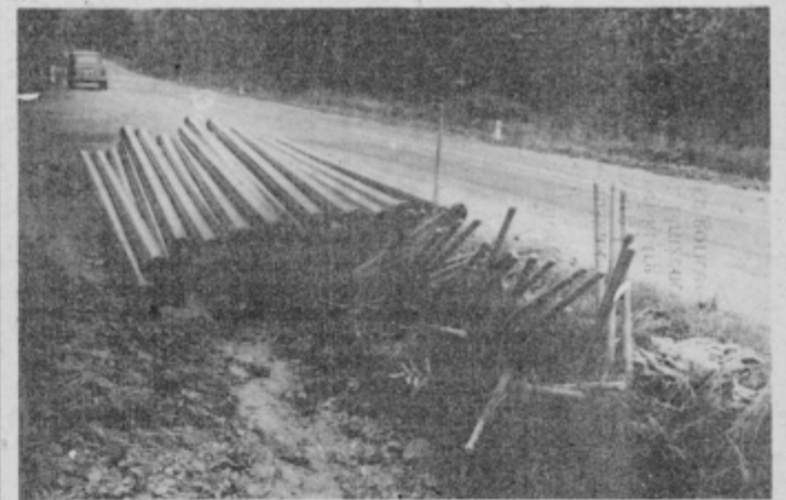
Lopate in cevi čekajo na krepke roke brigadirjev.