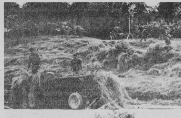
Teritorialci sodelujejo z gostitelji in jim pomagajo pri spravilu sena.