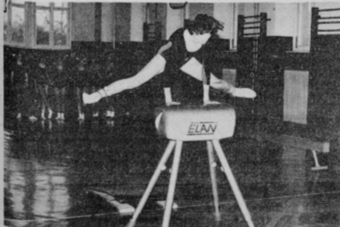
Članice TVD Partizan redno vadijo.