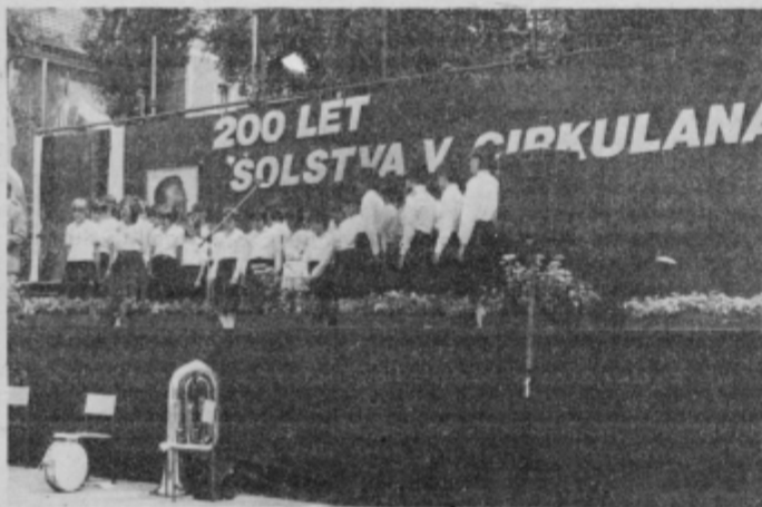
Mladi pevci in recitatorji med izvajanjem programa.