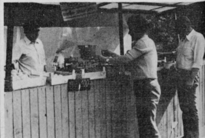
Na tržnici v Kidričevem.

Ne bi mogli trditi, da naselje Kidričevo ni zadostno oskrbljeno s sadjem in zelenjavo. Imajo lepo urejeno tržnico pred pekarno, kjer je bo sobota in nedelja pa tudi ob praznikih potrošnikom na voljo dovolj blaga. Zal pa so cene izredno visoke, tako sadju kot zelenjavi, in tudi sedaj, ko je česnje in zelenjave dovolj, cene nikakor nočejo navzdol. Besedilo in posnetek: Konrad Zorc