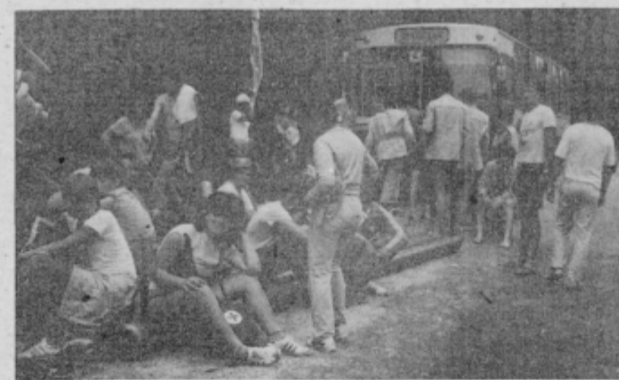
Po končanem delu na trasi priprava na odhod v brigadirsko naselje.

Ako želite doživjeti barem dio toga dođite nam u posjetu, neće vam biti žao.