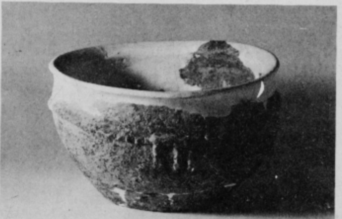
Globoka keramična skodela, ornamentirana s plastičnim horizontalnim in vertikalnim rebri, odkrita v ormoški prazgodovinski naselbini