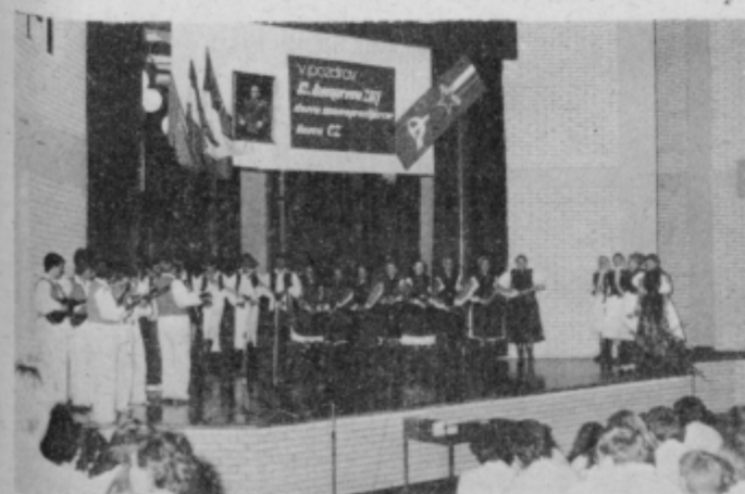
Člani folklorne skupine in tamburaškega orkestra DKUD Svoboda VIS Varaždin med izvajanjem programa.