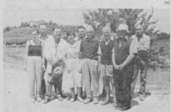
Skupni posnetek udeležencev letošnje slikarske kolonije na Gorci

Likovniki bodo na Gorci in v bližnjih haloških krajih ustvarjali še jutri, nakar bo žirija iz združenja likovnih skupin SR Slovenije pregledala opravljeno delo in izbrala slike za razstavo, ki bodo na ogled v ptujskem hotelu od sobote dalje.