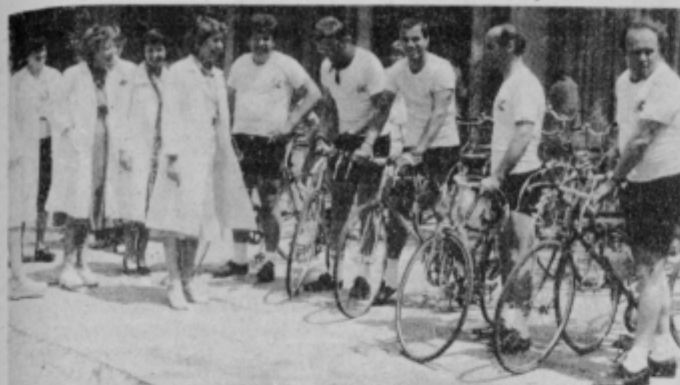
Kolesarji iz ljubljanske Kemofarmacije s svojimi gostitelji pred ptujsko lekarno.

V petek, 25. junija je marsikdo od Ptujčanov začudeno zrl pred ptujsko lekarno, kjer se je ob enajstih dopoldne zbrala skupina kolesarjev inokrog njihgruča ljudi. Šest kolesarjev, premočenih in utrujenih, je prikolosalilo v Ptuj iz Ljubljane, prek Dolenjske, Bizeljskega in Podčetrka do Celja in Slovenske Bistrice. To so bili udeleženci spominskega kolesarskega maratona ob 35-letnici Kemofarmacije iz Ljubljane.