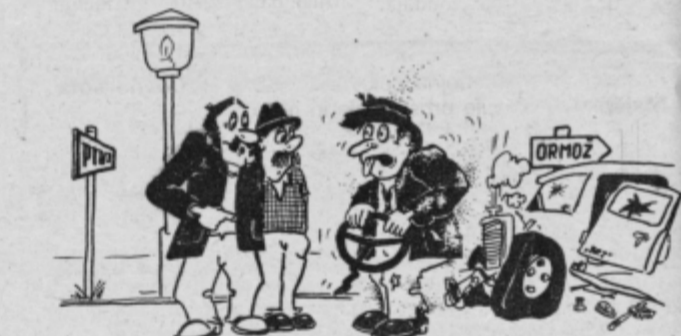
— Odkod pa ti, si imel prometno nesrečo? — Ne, samo skozi Borovci sem se peljal!