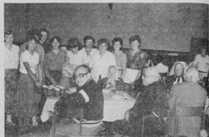
Brez teh prizadevnih organizatorjev prireditev prav gotovo ne bi tako uspela.

Vemo, da bi dvorana Svobode sprejela medse se več ostarelih ljudi, vendar le ti niso mogli priti, bodisi da so vezani na posteljo, ali drugače oslabei, nekateri pa niso imeli prevoza. V velikem veselju sem v dvorani