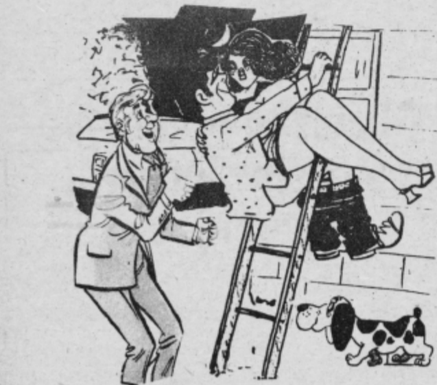
Bravo Ivan, predlagal te bom za poseben dodatek, ker opravljaš kmetijsko pospeševalno službo tudi ponoči.