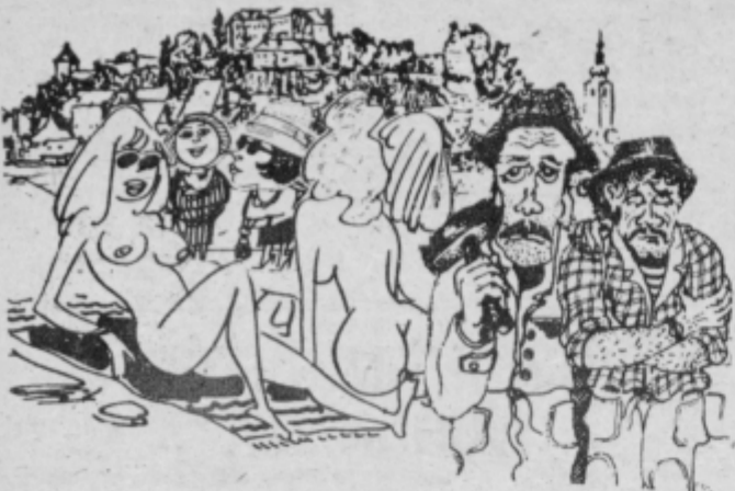
Zdaj še gre, ko si lahko napeseš oči po mesu, toda, kaj bo v jeseni in pozimi?