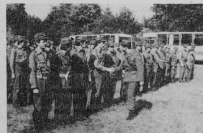
Komandant čestita najboljšim.