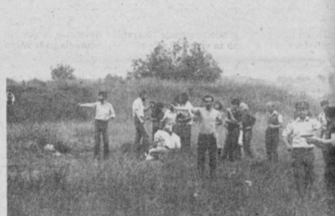
Delavci KBM—PE Ptuj na enem od treningov v Babosekovi jami.