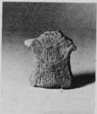
Antropomorfna plastika, z nakazano obleko, odkrita v ormoški prazgodovinski naselbini.