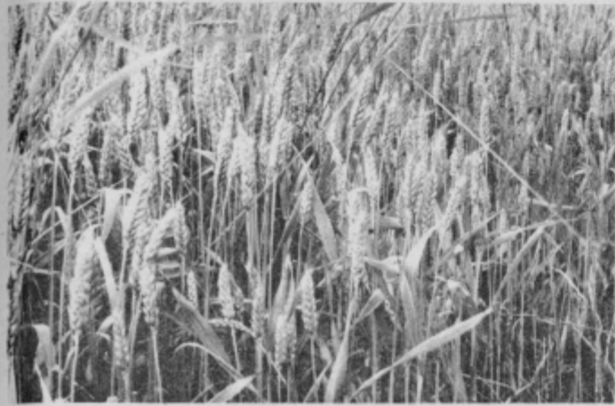
Skrbno pospravimo vsak klas pšenice, poskrbimo, da bo vsako zrno šlo za prehrano ljudi.