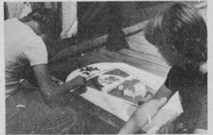
Po napornem delu na trasi so popodne na vrste razne aktivnosti.

I sve je u duhu zajedništva. Svako druženje, bilo ono na sportskim borilištima ili na pozornicama, čini da nakon mesec dana budemo mnogo bogatiji, iskusniji, izgrađeniji.