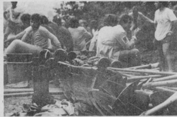
Trenutek oddiha po napornem delu.