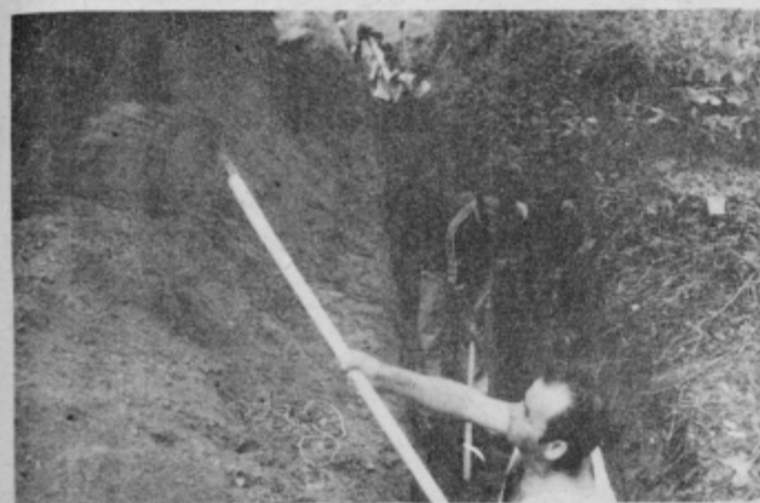
Brigadirji in veterani na skupni akciji.