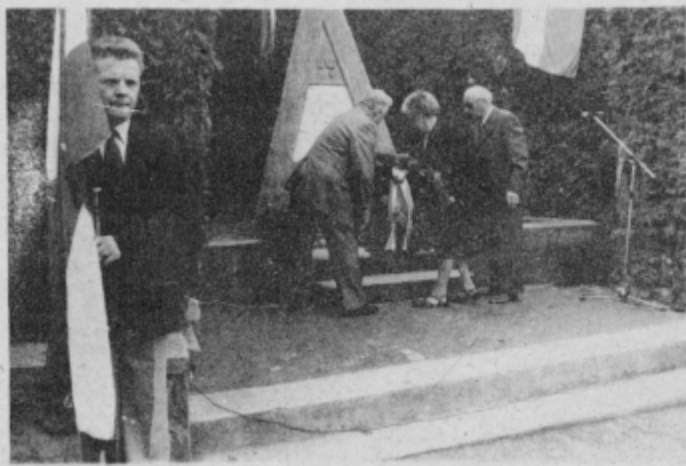
— V začetku slovesnosti je delegacija KO ZZB NOV položila venec k spomeniku žrtvam za svobodo s tega območja