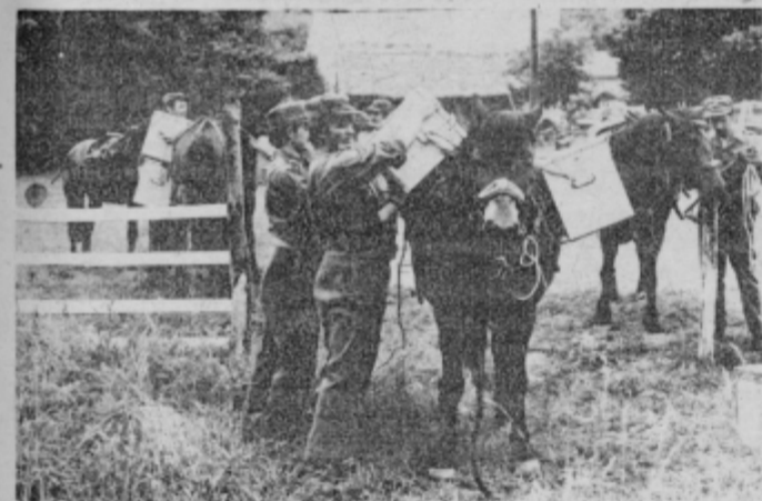
Transport za hribovite predele, kjer avto »omaga«.

Kot padalci plavega so bili v akcijo vključeni teritorialci, ki so organizirani po krajevnih skupnostih.