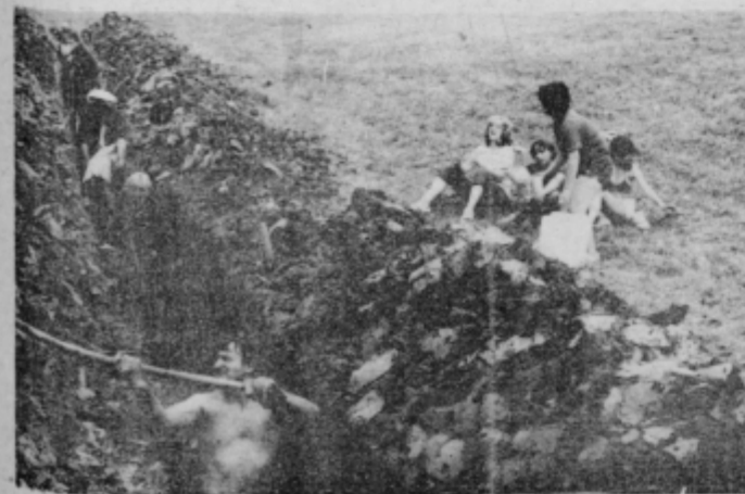
Med delom se je treba tudi odležati in za trenutek odpočiti.

ORB «Karel Destovnik Kajuh», Titovo Velenje