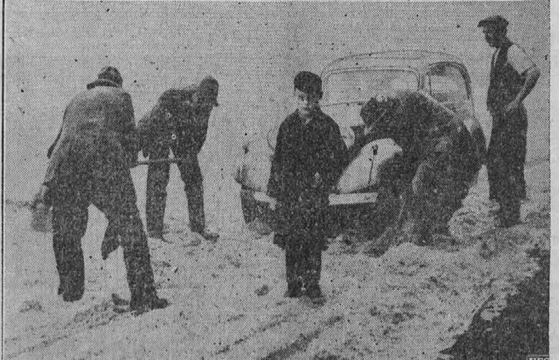
Nekaj neverjetnega je sicer to, kar kaže gornja slika, vendar je resnično, namreč, da so morali v mesecu avgustu izkopalati avtomobil iz snega. Ni pa se to pripetilo kje v južni Ameriki, kjer imajo v tem času redno zimsko dobo, marveč na Angleskem v Yorkshire. Dočim smo se drugod dušili v vročini, so se tam borili s snegom.