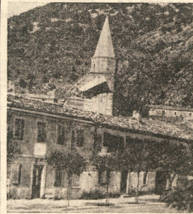
Slovenska zastava vohra z zvonika v Boljuncu

Od samotne farne cerkve na Vojskem, ki je bila skrita nekje za bregom, so nam oglašili zvonovi in oznanjali novi dan. Od prejšnjega dne obo ne nisem pomislil na to, a tedaj mi je zopet jasno stopilo v zavest, da je velika nedelja. Zdelo se mi je, da oznanja ptičje petje, rožnate barve neba in glasovite bronca, ki so leteli preko višin in se izgubljali v dolini. Za trenutek me je obšla varljiva misel, da ob vsaj ta dan prenehalo osvoboditveno in da se nam nič hudega ne more zgoditi.