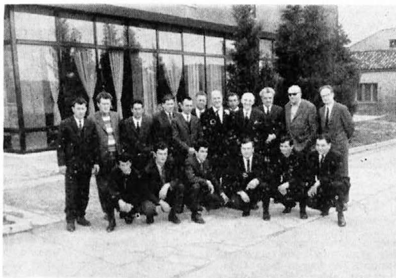
Naši člani ribolovnega obrata so uspešno opravili izpite za ladjevodje in krmarje. Čestitamo! Na sliki zgoraj: Ladjevodje s člani izpitne komisije ob opravljanju izpitov