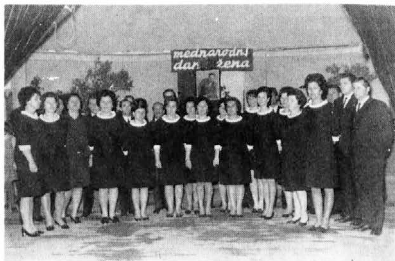
Ob dnevu žena je bila v Dvorih nad Izolo proslava, na kateri je nastopil tudi mešani pevski zbor iz Izole, ki ga vidimo na sliki. V zboru je tudi več članov in članic našega kolektiva, ki aktivno sodelujejo.

Kdor živi v bodočnosti, temu je lahko ostati mlad, ne glede na leta. To lahko storite tudi vi, če poskušate in se malo potrudite. Ostanite duševno budni in aktivni — to je edini eliksir mladosti, ki zanesljivo deluje!