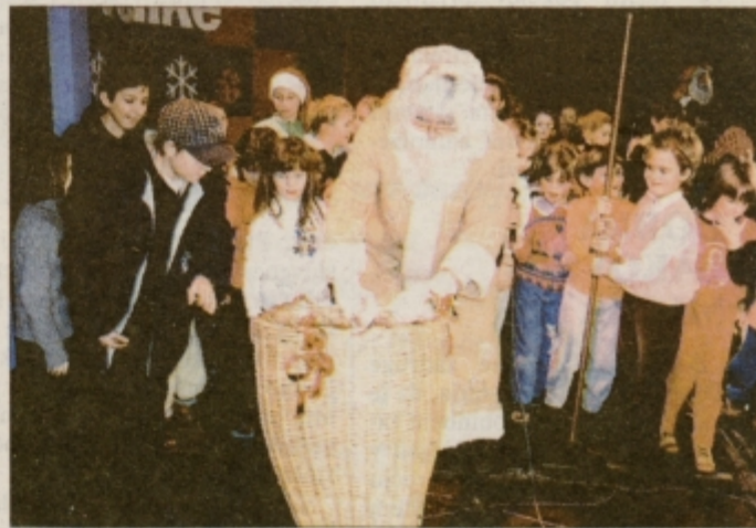
... in otroška prireditev Za male in velike.