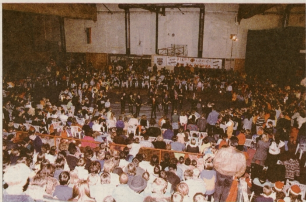
Male čaravnice Plesnega centra Mambo v polni dvorani Šolskega centra.