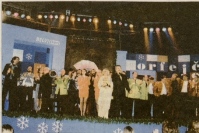
Orfejkova parada '99 ...

Več o obeh prireditvah v drugem delu časopisa.