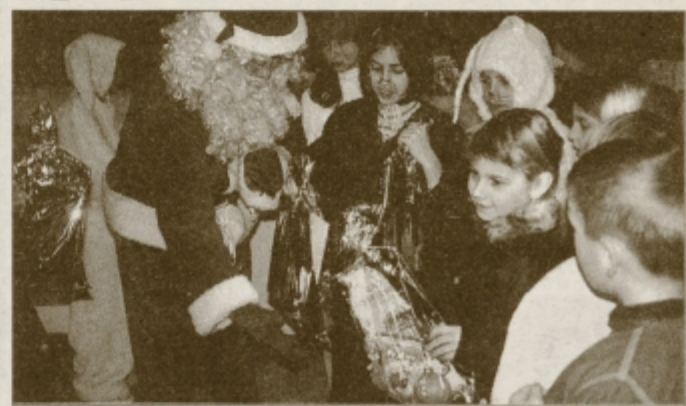
MS Dedek Mraz med otroki

Najmlajše v občini Dornava je v prejšnjem tednu obiskal dedek Mraz. Obiskal jih je v vrtcu, v zavodu dr. Marijana Borštnarja in v vaški kulturni dvorani. Obdaril jih je z igrice Janko, Metka, Sneguljčica in Rdeča kapica iščejo dedka Maraza, ki so jo pripravili učenci iz osnovne šole, in z darili. Najmlajši so bili daril zelo veseli.