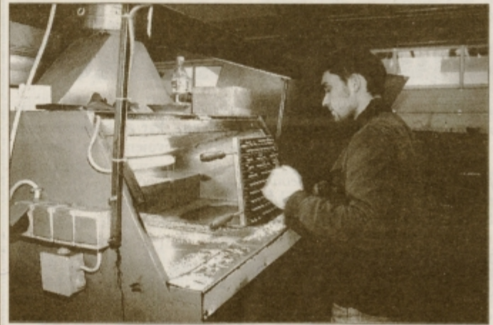
V osmih letih je proizvodnja brezračnih ventilov narasla s 30 tisoč kosov letno na 25 milijonov.

lokaciji so proizvajali skoraj deset let, do gradnje sodobnega proizvodnega prostora v izmeri 450 m 2 . To je pomenilo preporod v dotedanji proizvodnji. Že od začetka so proizvajali najrazličnejše gumene izdelke (tesnila, amortizerje, kolesa, mehove ...) za podjetja Prosan (prejšnji Metalplast), Iskra Nova Gorica, TVT Maribor, Savo Gumarno Ptuj in druge posamezne kupce, za katere delajo še danes. V zgodnjih devetdesetih letih so