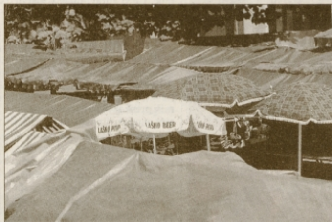
Ptujška tržnica je neurejena v vseh pogledih ...

Člani Turističnega društva Ptuj se tudi zavzemajo za kvalitetnejšo osvetlitev mesta. Na nekaterih mestih javne razsvetljave sploh ni, tudi zaradi tega mesto ob večerih deluje zelo neprijazno.