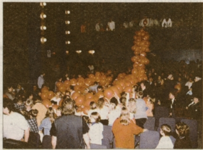
Ob zaključku lenarškega prednovoletnega "spektakla" se je proti stropu dvignilo 400 balonov, ki so jih bili še posebej veseli najmlajši