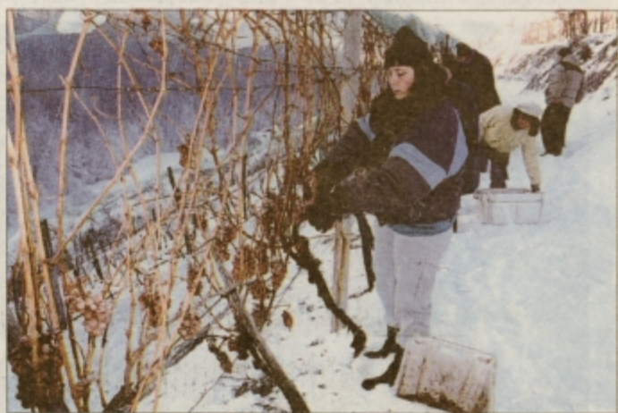
Ledena trgateg pri minus 19 stopinjah v Cikušaku na Velikem Vrhu pri Borlu