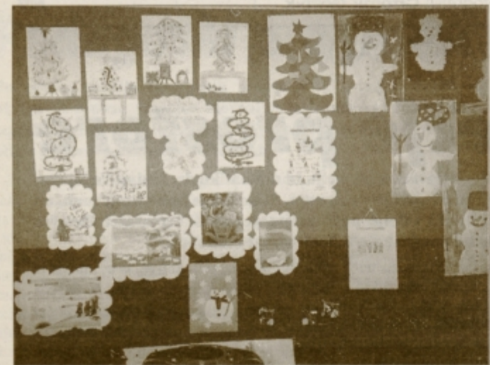
Najiskrenejše so voščilnice, ki jih izdelamo sami, so prepričani otroci v Leskovcu