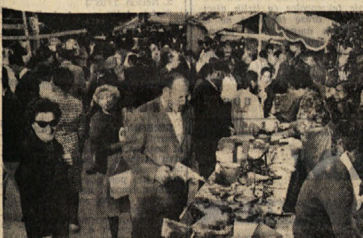
Na Repentabru se je prav tako zbralo mnogo ljudi