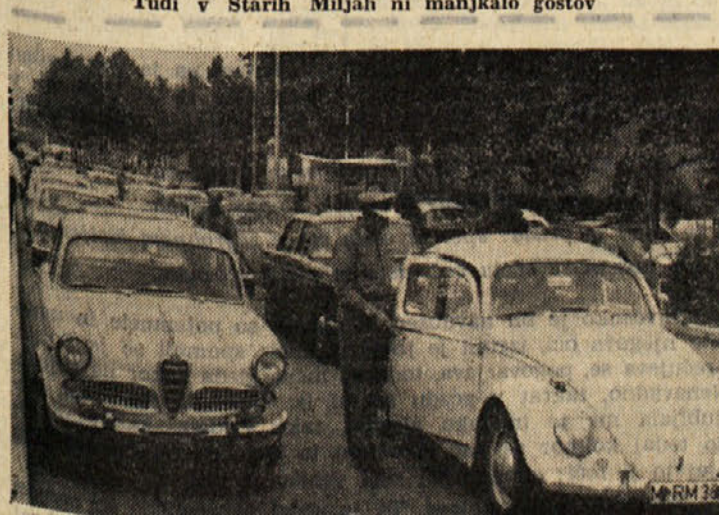
Na mejnih prehodih se je promet, kljub velikemu številu vozil, še kar hitro razvijal. (Na sliki prizor na mejnem prehodu pri Škofljah)