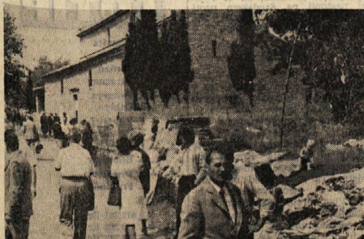
Tudi v Starih Miljah ni manjkalo gostov