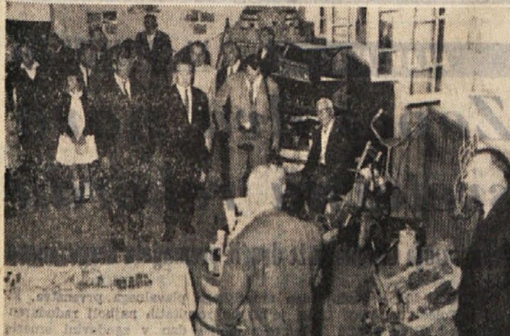
Z uradne otvoritve VII. kmečkega tabora