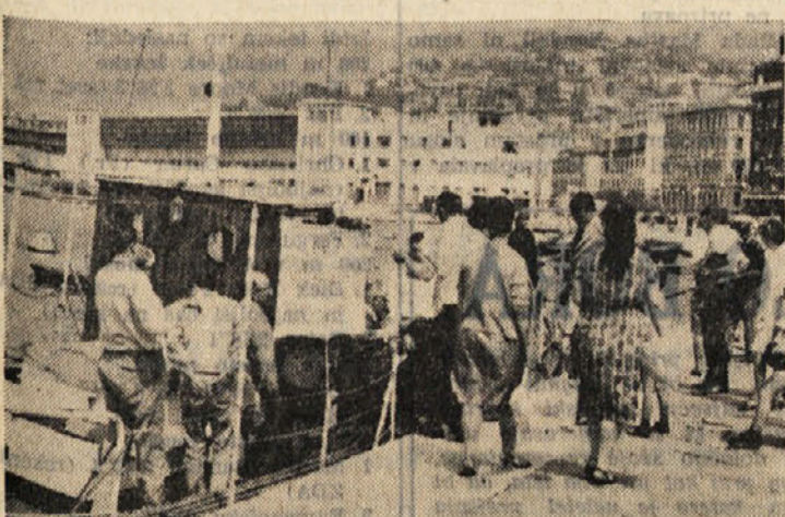
Kratek izlet po zalivu je za tujega turista izredna zanimivost