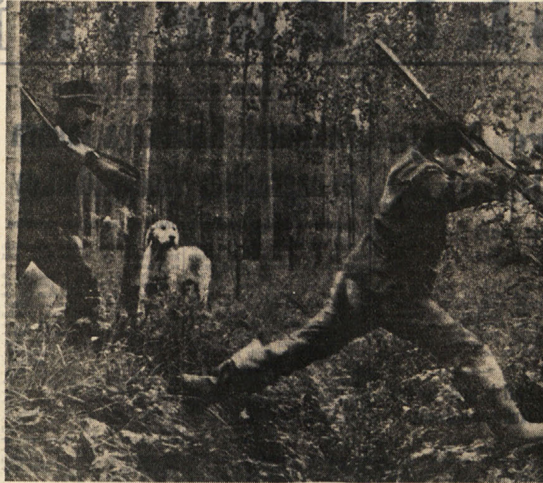
Lov spada med najlepša športna razvedrila že zaradi tega, ker je povezan z naravo, predvsem z gozdom in njegovim pestrim živalskim ter rastlinskim življenjem. Ne gre toliko za to, da na njem kaj upleniš, marveč, da se naujiš pristnih lepot in si pridobiš novih moči za vsakodnevno delo. Na sliki dva lovca in pes v pogonu za prepelicami

Vse to v bistvu pa še manj spreminja dejstvo, da vsi oni činitelji, ki iz Azije skušajo napraviti nekakšno trdnjavo svoje nevarne politike, iščejo svoje argumente in opravičila s tem, v zvezi prav v nevarnosti kitajske svetovne revulucije, oziroma, kot pravi predsednik Johnsona, v grožnjah azijskega komunizma.