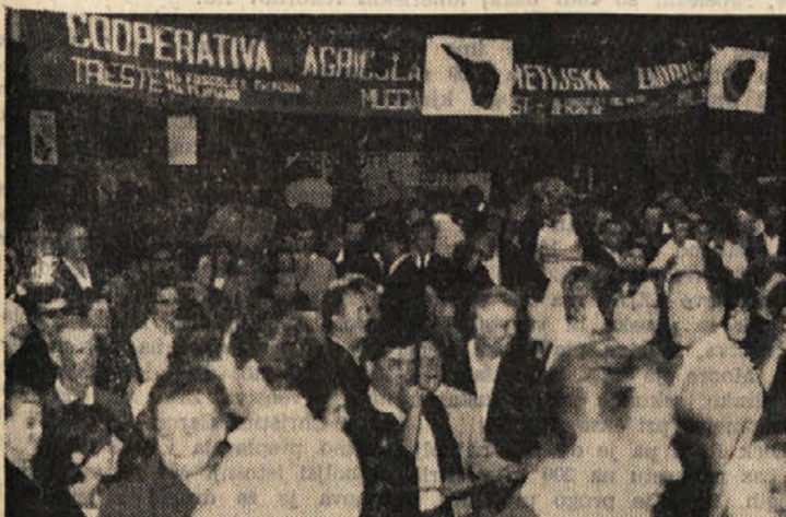
Del množice na Kmečkem taboru v nedeljo