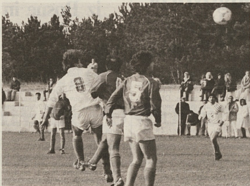
Posnetek z lanskega slovenskega derbija med Primorcem in Sovodnjami.