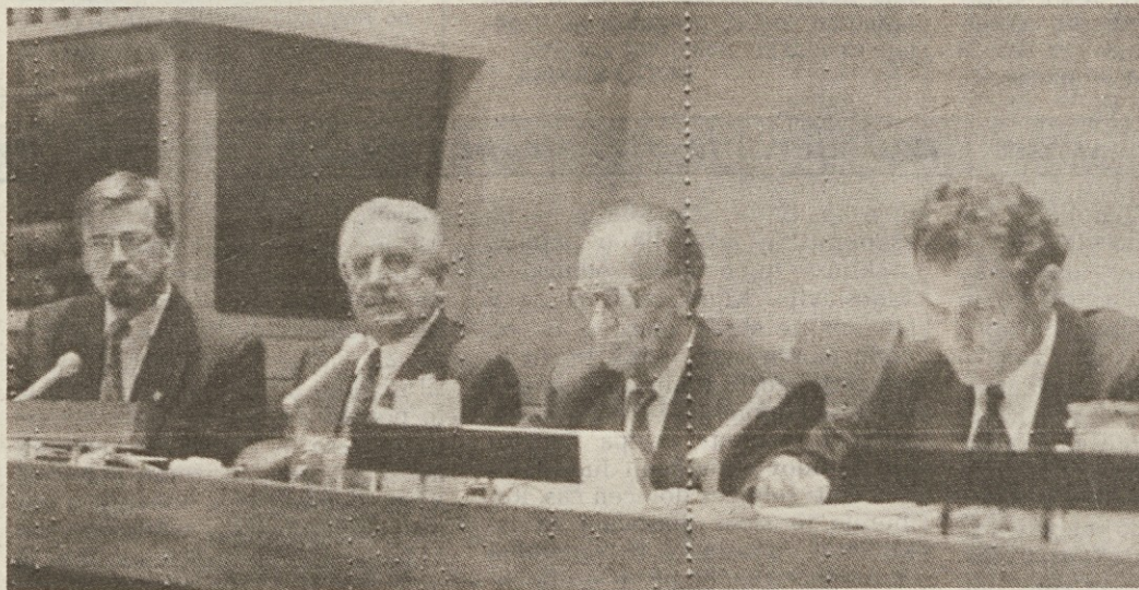
Hrvaška in bosanskohercegovaška delegacija s predsednikoma Tudjmanom in Izetbegovićem

LJUBLJANA — Poleg izključitve tako imenovane Zvezne republike Jugoslavije iz Svetovne organizacije, je včeraj v svetovnih medijih odmeval zlasti sporazum o hrvaško-bosansko-hercegovski obrambni zvezi, ki sta ga v New Yorku v sredo zvečer podpisala ter na novinarski konferenci na sedežu Združenih narodov razglasila predsednika Hrvaške ter Bosne in Hercegovine Franjo Tudjman in Alija Izetbegović. Predsednika sta pravzaprav podpisala aneks k sporazumu o prijateljstvu in sodelovanju, ki je bil sklenjen že 21. julija letos. Z aneksom sta ustanovila skupni odbor, ki bo usklajeval vojaške akcije do ustavitve vojne. Prejšnji sporazum je obravnaval zgolj skupno mejo, zdajšnje dopolnilo pa skupne obrambne operacije razširja na območje obeh republik. Predsednika Tudjman in Izetbegović sta tudi sporočila, da bosta od Združenih narodov uradno zahtevala, naj prekličejo prepoved prodaje orožja Hrvaški ter Bosni in Hercegovini.