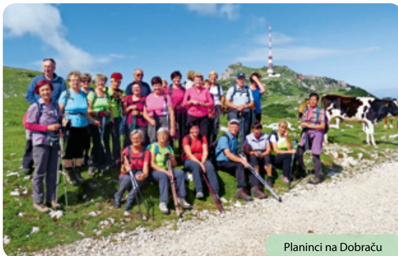
Planinci na Dobraču