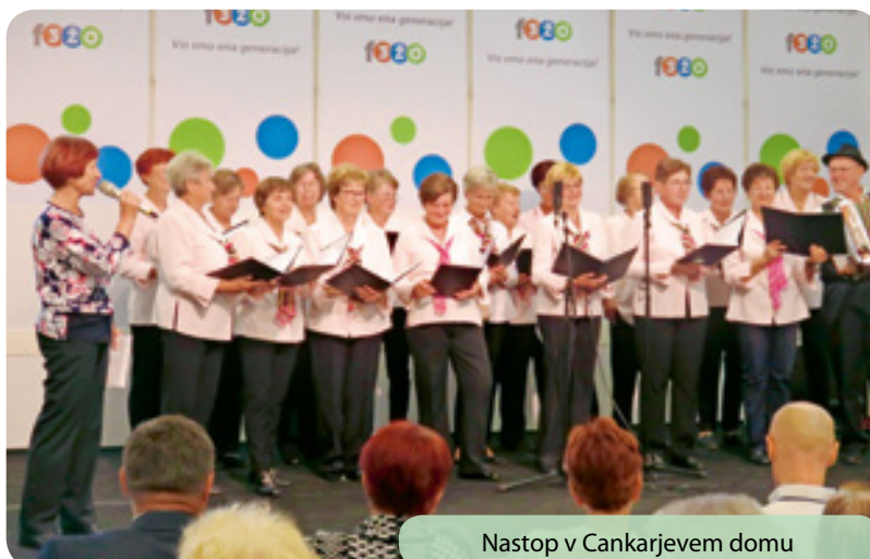
Nastop v Cankarjevem domu