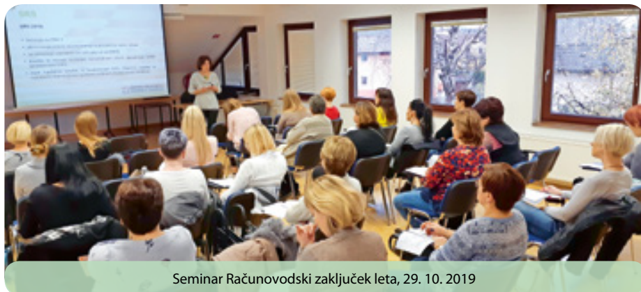
Seminar Računovodski zaključek leta, 29. 10. 2019