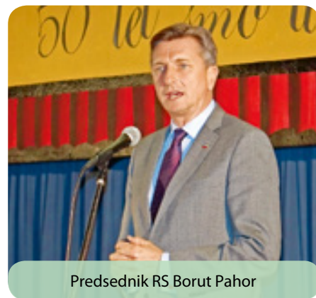
Predsednik RS Borut Pahor

Povedala je, da ko letno sprejmejo medse nekaj novih učencev v program nižjega izobrazbenega standarda, za-