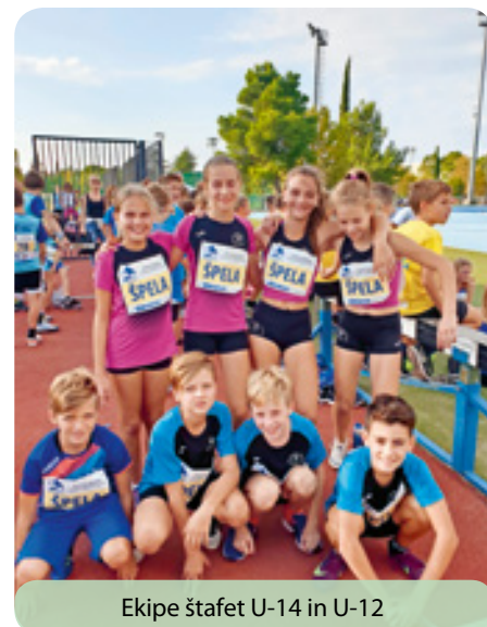
Ekipe štafet U-14 in U-12