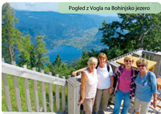
Pogled z Vogla na Bohinjsko jezero