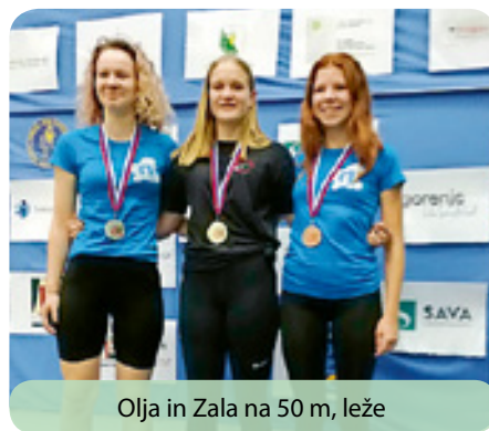
Olja in Zala na 50 m, leže