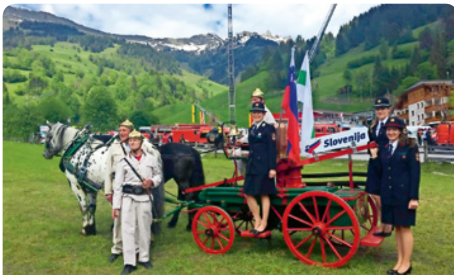
Udeležba na mednarodnem srečanju gasilcev v Dorfgasteinu v Avstriji, 2019