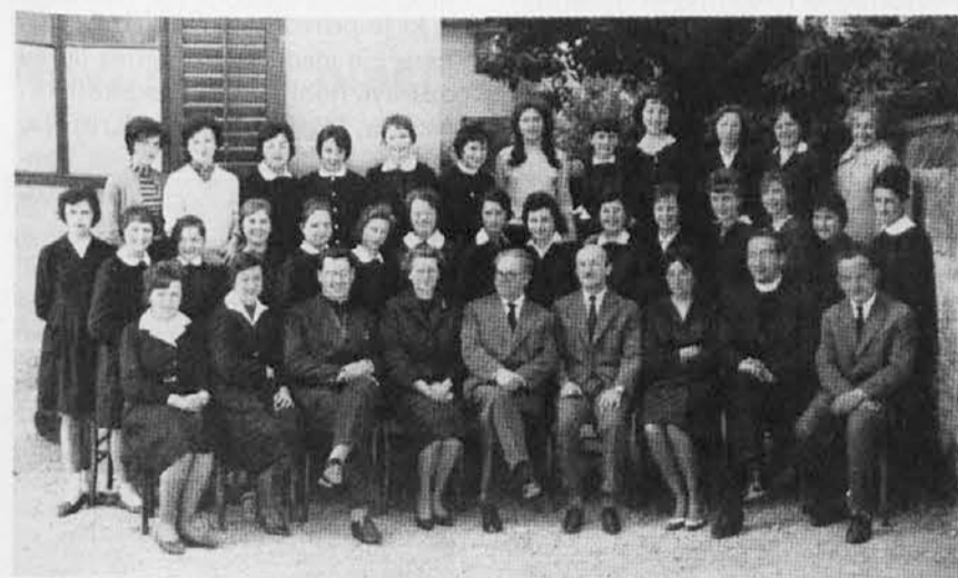
Šolsko leto 1960-61 - Dijaki III. B razr. Nižje srednje šole