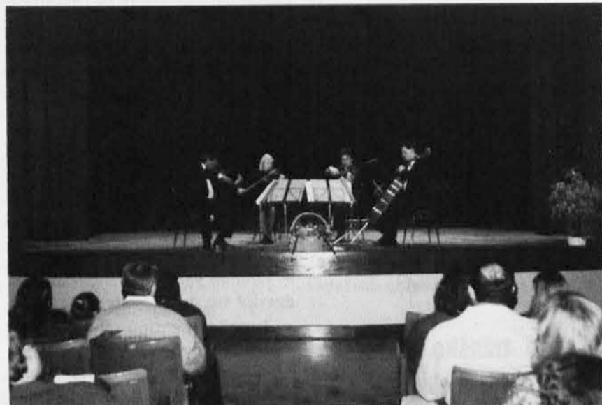
Godalni kvartet Glasbena matica iz Trsta koncertira v Katoliškem domu v Gorici

Pojav tržaškega Godalnega kvarteta nas navdaja z optimizmom — danes so taki slučajji bolj redki — ker dokazuje, da tlije še nekaj ustvarjalnosti v našem glasbenem zamejstvu. Ko pomislimo na vse povojne generacije, ki so izšle iz naših glasbenih šol, se nam zdi, da je njihova odmevnost v našem umetniškem snovanju le preskromna. Prepogosto se dogaja, da diploma s konservatorija — lepo uokvirjena — krasi steno dnevnice sobe. Le redki in srečnejši si z njo lahko služijo vsakdanji kruh. Ali ni tudi to vredno razmisleka?