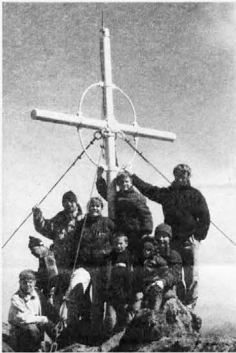
Zgoraj: Skupina Bariločanov na vrhu Capille ob križu.