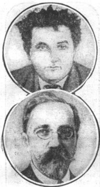
Boljševiška voditelja: zgoraj Zinovjev, spodaj Kamenov, ki sta bila baje aretirana, češ, da sta podpirala opozicijskega Trockija