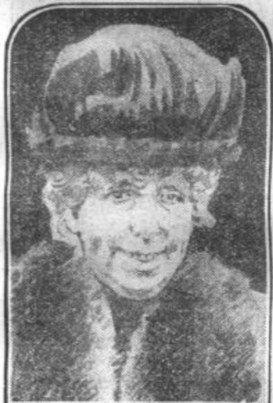
Španska kraljica Marija Kristina je pred dnevi umrla