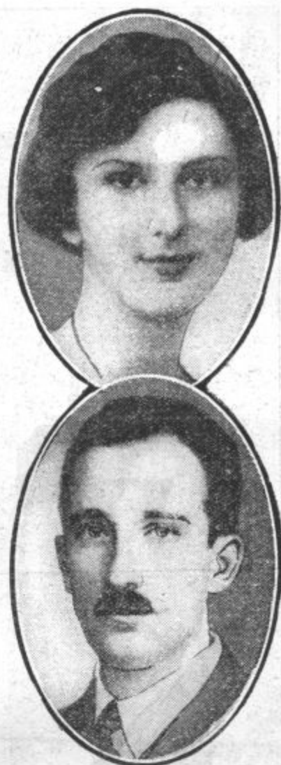
Italijanska princesa Giovana in bolgarski kralj Boris, ki se v kratkem poročita. Razlika ver ju ne moti. Bolgarski kralj je pravoslavne in princesa Giovana pa rimsko katoliške veroizpovedi. Zakonske zveze med vladarskimi rodbinami so politično zelo pomembne. Tako je tudi predstoječa poroka bolgarskega kralja in italijanske princese za Italijo važna