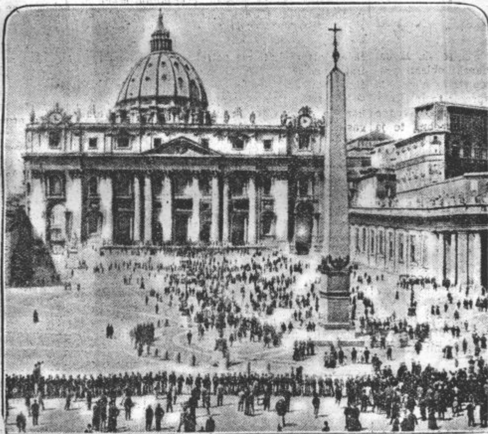
Cerkev sv. Petra v Rimu