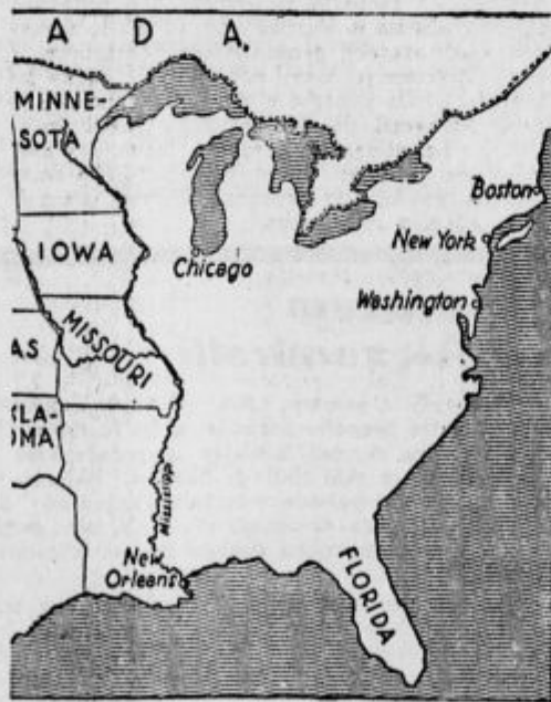
Poplavljeno je vso obrežje Mississippija, južno od Chicago, skozi katerega teče reka Ohio, ki se zliva v Mississippi pri srednjem kolenu.

Mestni svet je v ponedeljek imenoval mestnega diktatorja z najobširnejšimi pooblastili. Takoj je odredil, da smejo prebivalci samo eno uro na dan natakati vodo iz mestnega vodovoda, ker so sesalke pod vodo. Sesalke bodo mogle začeti šele, kadar bo voda najmanj za 4 m vpadla.