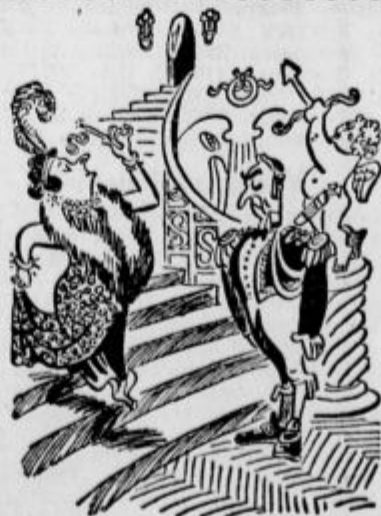
Imenitna gospa: »Zan, povejte, ali je to zadnja stopnjica!«

Za Rusijo je pisatelj obiskal tudi Kitajsko. Tudi o svojih tamkajšnjih vtisih takole kratko poroča: »Tukaj sem videl isto, kar v Franciji in v Rusiji. Mladino, katero so zmedli njeni vzgojitelji in pa pretres: na svetu, da je nazadnje zavrgla vse spomine na preteklost: spoštovanje do starosti, vezi krvi, skutnje in vse drugo. V teh treh deželah, ki jih dobro poznam, sem povsod videl isti tip mladih ljudi.«