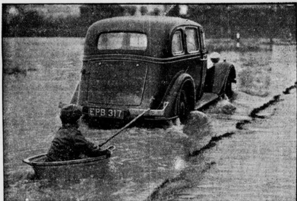
Povodenj pri Londonu: Tudi povodenj dobro služi takemu le malemu paglavcu. Medtem ko mora avto bresti po poplavljenih cestah, močiček praveže za avto svojo kad ali kak čeber ter se potem kakor v motornem čolnu pelje proti Londonu.

Manila je bila tako rekoč ustanovljena še le 1521 leta, ko je veliki raziskovalec Ferdinand de Magalhaes na svojem potovanju okrog zemlje slučajno zadel na neštivilno otočje, ki je pozneje dobilo ime Filipinov in se ustavljal tudi v obrežni ribiški vasi, kjer leži sedaj mesto s skoraj 400-tisoč večinoma katoliškimi prebivalci, prestolica Filipinov, ki so ravno lansko leto postali samostojna država pod silno odaljenim nadzorstvom