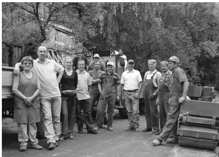
Delavci režijskega obrata Destrnik skupaj z mlekarji Občan - 22. november 2007