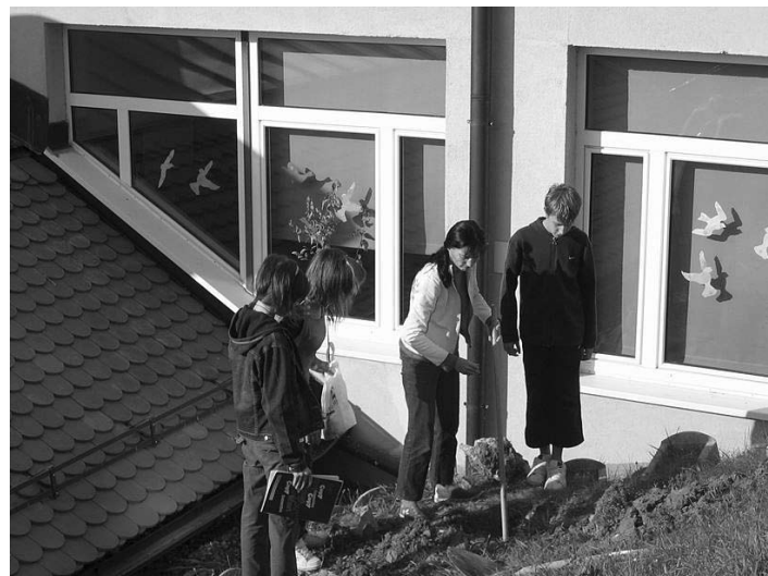
Posadili smo drevo