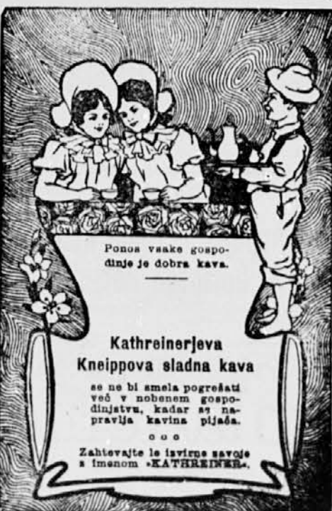
Ponos vsake gospodnje je dobra kava.