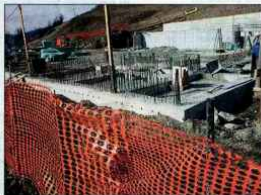
Od telovadnice za zdaj stojijo le temelji.