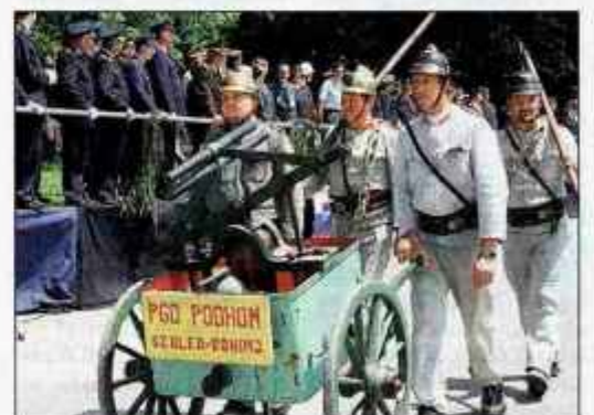
Prizor s predlanske parade na Bledu: gasilci so lahko zanimiva atrakcija za domače in tuje obiskovalce.