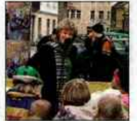
Zabava na Tednu mladih.

"Na staro mamo iz Cerkele, kjer sem preživela veliko lepih trenutkov. Imeli sva se zelo lepo. Še danes se zelo dobro spominjam, da je med pripovedovanjem pravljic pogosto zadremala. Naučila me je skuhati žgance."