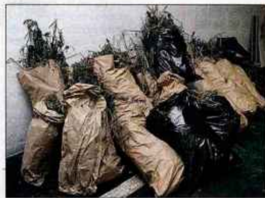
V hišni preiskavi zasežena konoplja, za katero se je kasneje izkazalo, da je industrijska.

Sodišče obdolženčevim besedam ni verjelo. "Vaš zagovor je neprepričljiv in neverodostojen. Sodni se-