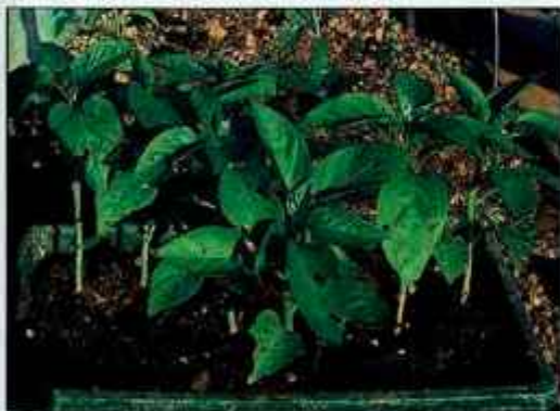
Papriko smo iz zabojčkov presadili na vrt. Pokrita bo do sredine junija.

Rumeno korenje ima dve dobri lastnosti: jedem zelo izboljša okus, je pa tudi zelo obstojno, saj ga lahko uporabljamo do pozne pomladi prihodnjega leta. Zdaj je skrajni čas, da ga posejete, saj kali zelo dolgo časa - tja do meseca dni. Pri kaljenju potrebuje tudi veliko vlage, zato ga posejemo zdaj, da bi ušli morebitni suši. Na vrtu ga posejemo na stalno mesto in to "na redko". Ko bo zrastle in ga bomo morali okopati, ga bo verjetno treba še razredčiti. Če želimo imeti debelo korenje, je priporočljivo, da je v vrsti med posameznimi rastlinami deset centimetrov prostora, med vrstami pa 40 centimetrov.