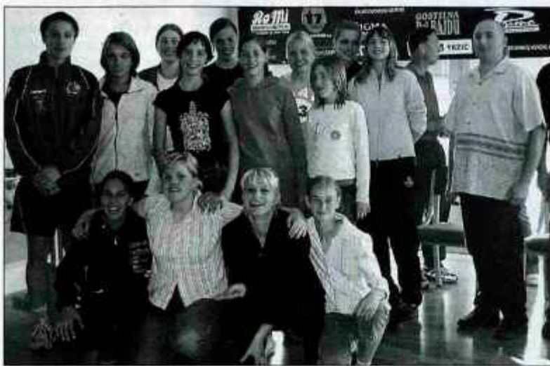
V novih prostorih kluba v večnamenskem centru v Naklem so rokometiške RK Vita Centra zaključile letošnjo uspešno sezono.

Tudi zbrane rokometiške, njihovi trenerji, straži in predstavniki sponzorjev so se razveselili pomembne pridobitve kluba, dekleta pa so zbranim gostom predstavila svoje delo in načrte. "V minuli sezoni smo članice našega kluba tekmovala z enajstimi ekipami, od tega jih je šest nastopalo v mini rokometu. Najboljši rezultat sezone so dosegle kadetinke, ki so v državni ligi osvojile šesto mesto, v kategoriji mladink pa smo v predtekmovalju osvojile 4. mesto. Tako so