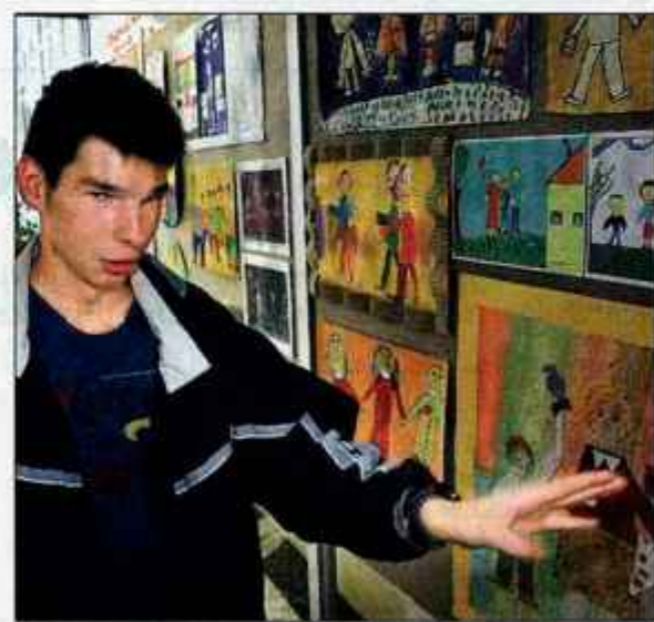
V preddverju zavarovalnice Triglav je na ogled razstava likovnih del, ki so jih otroci ustvarjali na temo Moja družina.