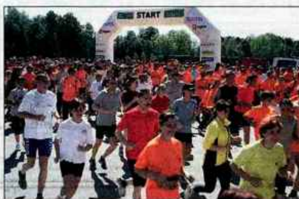
Na županovem teku na Brdu je bilo skoraj tisoč tekačev.