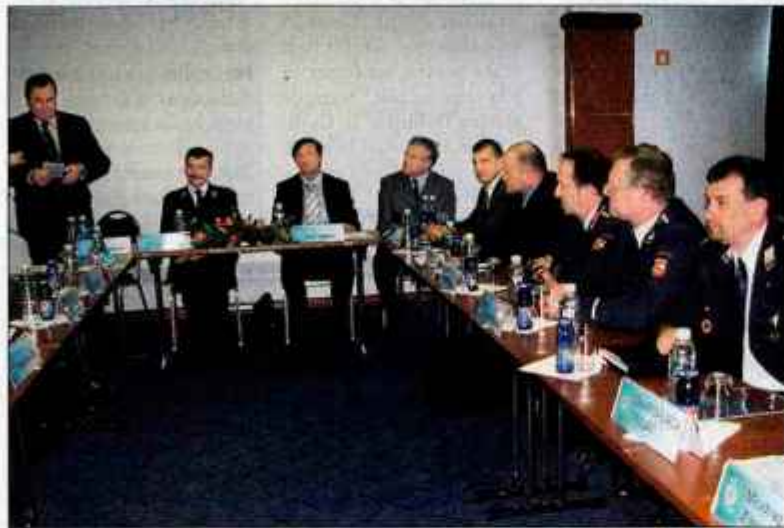
Organizacijski odbor mednarodnega srečanja gasilcev med prvo sejo.

"Če pomislimo, da imamo več kot 120 tisoč gasilk in gasilcev, že to priča, kako je izjemno dobro razvito naše gasilstvo. Dolga tradicija je še dokaz več za to. Tudi glede opremljenosti in usposobljenosti lahko rečem, da smo na vrhu evropskega in svetovnega gasilstva. Pred nedavnim sem v imenu ministrstva za obrambo predal tri specialna vozila za gašenje v predorih, ki bodo povečala