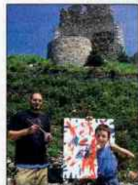
Grad je bil motiv za ustvarjanje na Extempore.