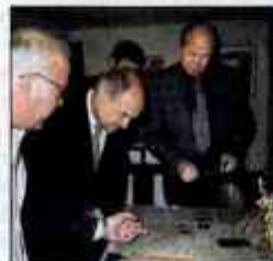
Avstrijski veleposlanik dr. Valentin Inzko v jalnovi hiši.

v Ljubnem. Na srečanju v Radovljici je poudaril, da so za dobro sodelovanje med sosedama pomembni predvsem stiki med prebivalci. Z zanimanjem je prisluhnil podatkom o zgodovini in kulturni dediščini mesta in občine, ogledal si je Linhartov trg in Šivčovo hišo in obiskal še turistično informativni center.