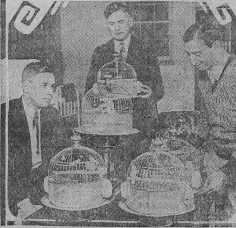
Na sliki vidimo skupino veteranov svetovne vojne, ki so si na fronti nakopali bolezen in se nahajajo sedaj v oskrbi v Municipal Tuberculosis sanatoriju v Chicagu, kjer gojijo kanarčke. Kletke dobijo večinoma v dar od dobrih ljudi.