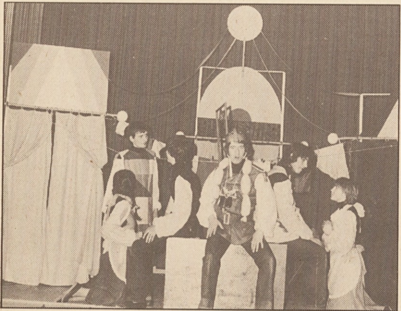
Prizor s premiere ODRA MLADJE „Hodl de Bodl“.