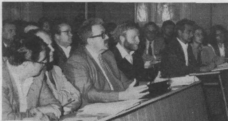
Dvorana krajevne skupnosti je bila za vse, ki so se želeli udeležiti zanimive sekcije o prenovi, skoraj pretesna.