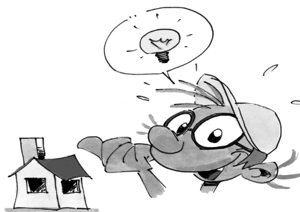
Slika 2: Korigiranje in ponovno preizkušanje (Papotnik idr., 2005)

Iz miselnega vzorca je razvidno, da »izhodu« pridobljeno znanje vrnemo, kot tehnično-fizikalne izkušnje, v življenjsko situacijo, iz katere smo izhajali. Pri ponovnem konstruiranju pa so te izkušnje prepoznavne kot predznanje za uporabo v novih primerih.