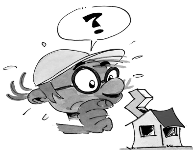
Slika 1: Preizkušanje konstrukcije (Papotnik idr., 2005)