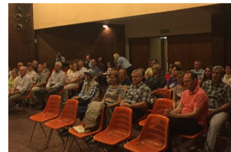
Med mašo v slovenskem domu v Mendози