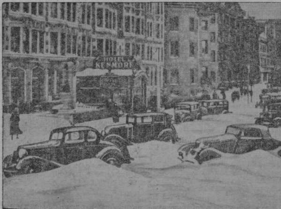
Sneg v Zedinjenih ameriških državah. Slika zasnežene ulice v vel mestu Boston. Desno: Snežni plaz v Alpah.