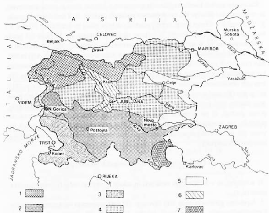
Slika 1: Naravnogeografska delitev Slovenije