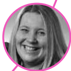
Nina Žbona Kuštrin Osnovna šola Solkan