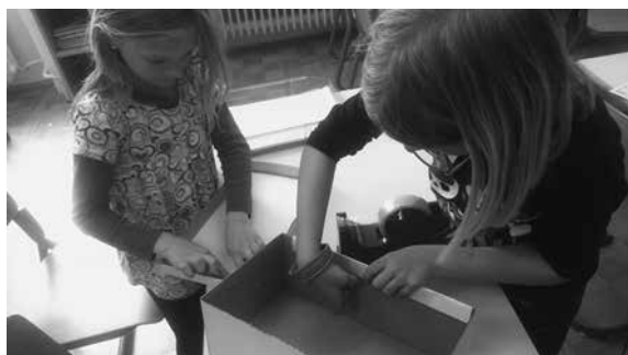
Slika 2: Izdelovanje poštnega nabiralnika

Iz škatle za čevlje so s pomočjo papirja izdelali šolski poštni nabiralnik. Škatlo so oblepili s papirjem, izrezali luknjo in nanjo napisali: poštni nabiralnik.