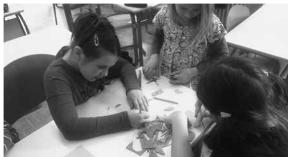
Slika 3: Izdelovanje šampiljke

vzorec, ki so ga izrezali. Kuvertu z znamko so ožigosali tako, da so šampiljko pomočili v tempera barvo in jo odtisnili na kuvertu. Ko se je barva posušila so kuvertu s pismom vrgli v šolski poštni nabiralnik.