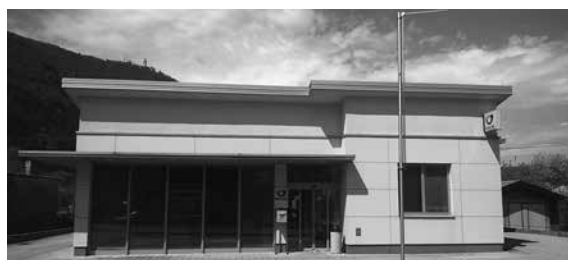
Slika 1: Pošta v Grgarju

Šli smo na ogled pošte v Grgarju, kjer nam je poštarica predstavila pošto, njeno delo, delo poštarjev raznašalcev, potek poštnega prometa in razkazala znamke.