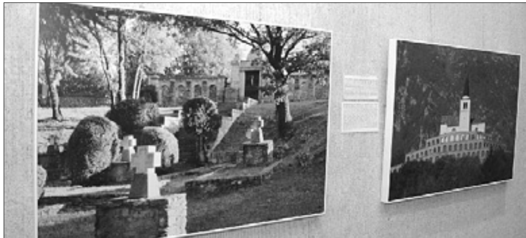
Dve izmed razstavljenih fotografij (levo) in govorniki na odprtju razstave v galeriji centra Lojze Bratuž (spodaj)