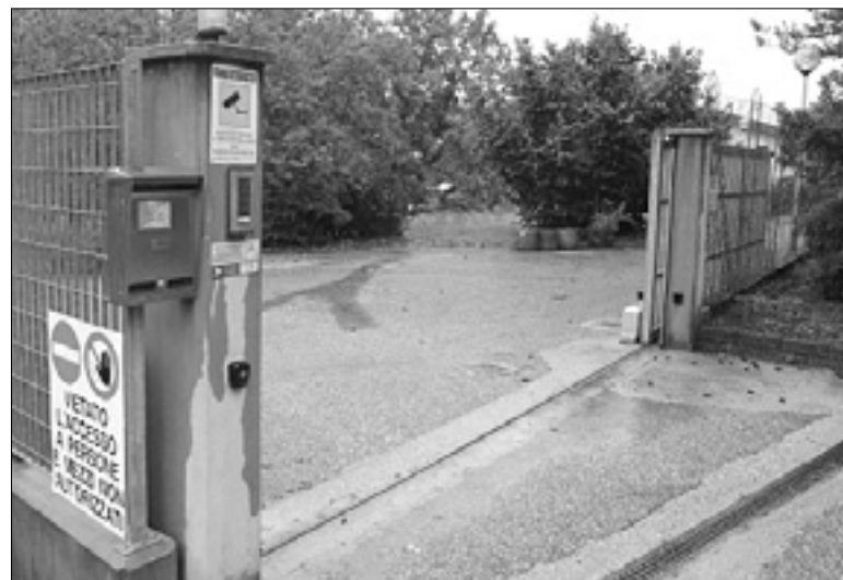
Vhod v občinsko drevesnico v Ločniku

Neznanci odnesli kosilnice in druge stroje, ki jih uporabljajo občinski delavci