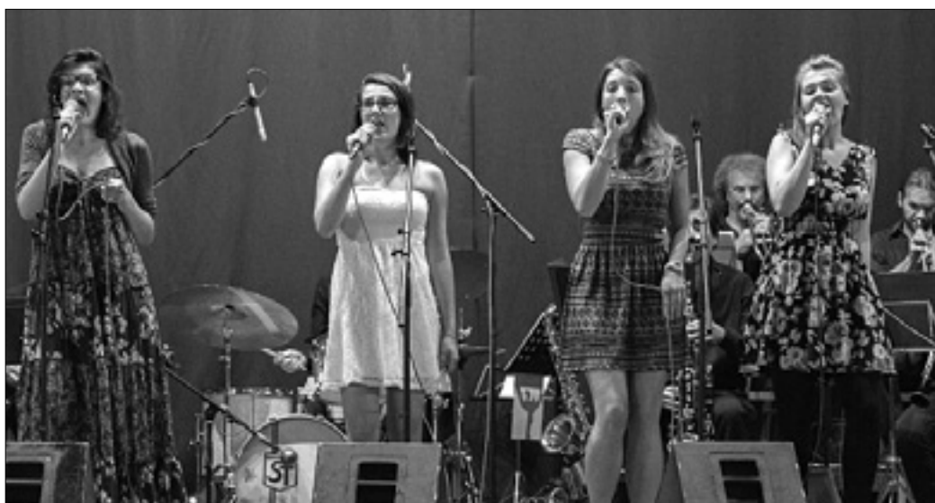
Utrinek z zadnje prireditve v sklopu Kriškega tedna 2014