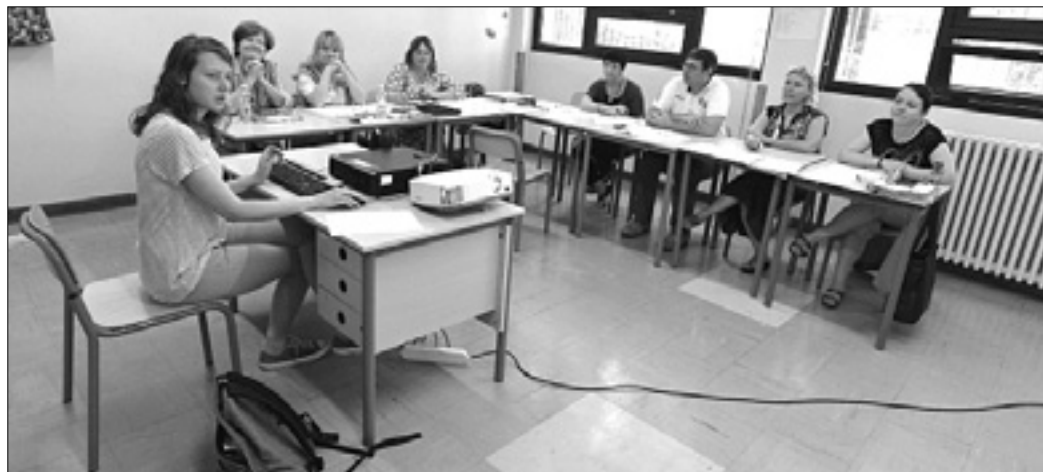
Med potekom ustnega izpita na »klasični«

Potek ustnega izpita na klasični smeri Liceja Franceta Prešerna