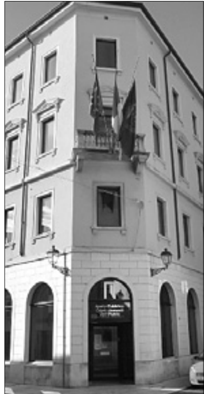
Sedež občinskih uradov v Ulici Garibaldi