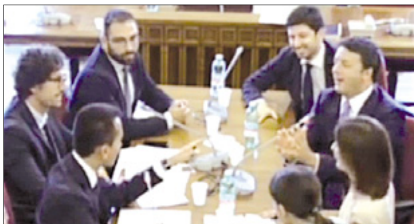
Udeleženci srečanja med DS in G5Z

Kot je bilo napovedano, so srečanje neposredno oddajale nekatere spletne televizije. Grillovi privrženci so uvodoma predstavili svoj zakonski predlog, ki osvaja proporcionalni volilni sistem, med drugim pa predvideva uvedbo ne-