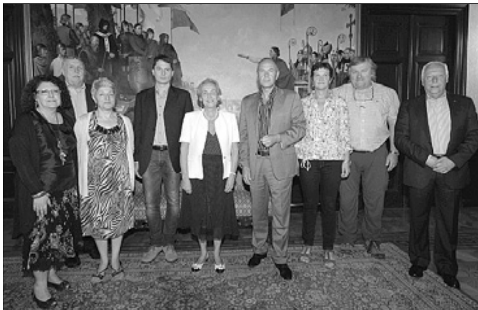
Pokrajinski in dolinski občinski upravitelji