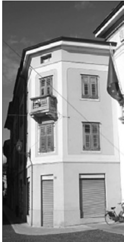
Občinska stavba v Ulici Mazzini

Del denarja, ki bo v občinsko blagajno priteklo od prodaje energetskega sektorja družbe Iris, je treba nameniti obnovi šolskih stavb. To je predlog leve sredine v goriškem občinskem svetu, ki je včeraj vložila amandma k letošnjemu občinskemu proračunu, o katerem bosta večina in opozicija glasovali 30. junija in 1. julija.