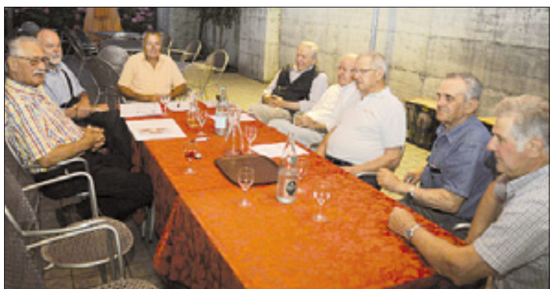
Udeleženci ustanovnega srečanja v Primožičevi gostilni v Gorici

Končne izide bodo že danes popoldne dočakali dijaki znanstveno-tehnološkega liceja Gregorčič ter dijaki in dijakinje zavoda Zois in Vega. Maturantje družboslovnega liceja Gregorčič in klasičnega liceja Trubar pa bodo morali počakati do sobote, ko bo nad letošnjo maturo v slovenskem višješolskem centru v Gorici padel zastor. (av)