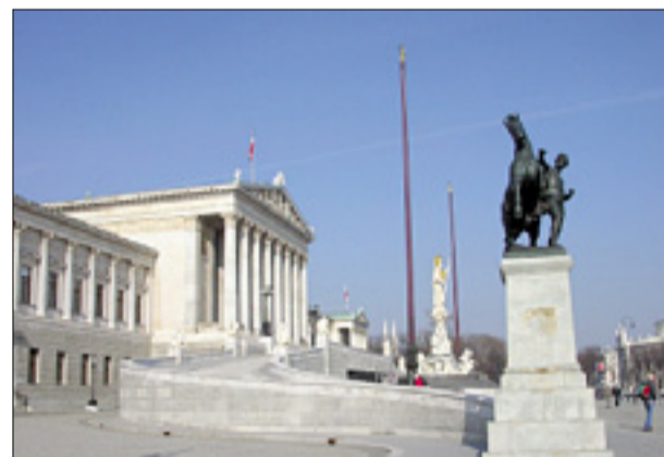
Poslopje avstrijskega parlamenta na Dunaju