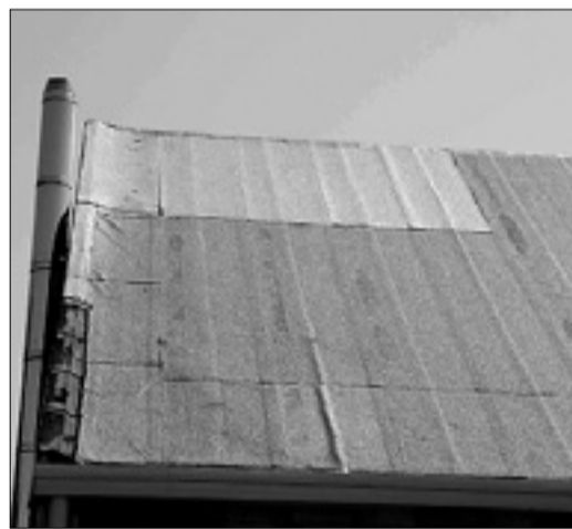
Streha telovadnice v Sovodnjah po urgentnih popravilih

V urgentna dela vložili 25.000 evrov - Potrebni bili bili tudi drugi ukrepi, ki pa jih bodo izvajali postopno glede na razpoložljiva sredstva