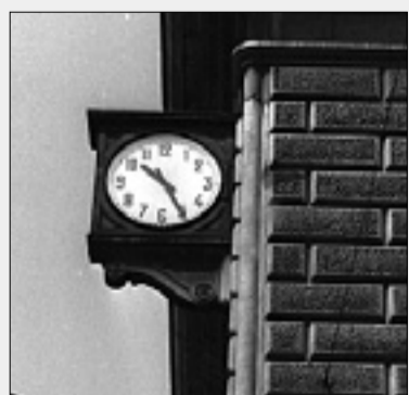
Ustavljen ura na postaji

Po tolikih letih se je včeraj prvič zgodilo, da množica ni izžvižgala predstavnika vlade. Včeraj je to bila ministrica za notranje zadeve Anna Maria Cancellieri, ki je bila v Bologni zaradi predčasnih volitev nekaj časa komisar občinske uprave. Ministrica je povedala, da je