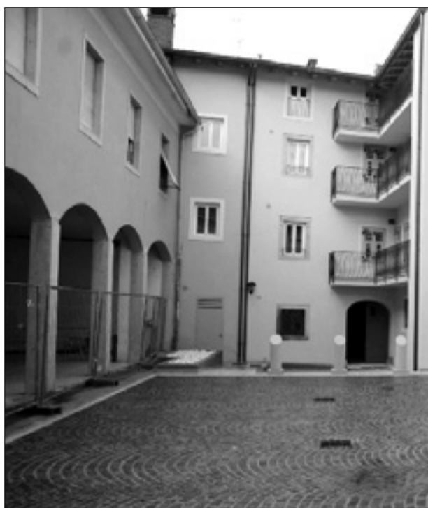
Junija letos je ATER predal namenu nova stanovanja v Ulici Mazzini v Gorici

Najemnina in stanovanjski stroški vse večje breme - V prihodnjih letih bodo oddali okrog 350 bivališč