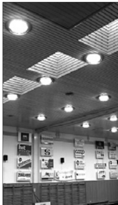
Nova stropna razsvetljava