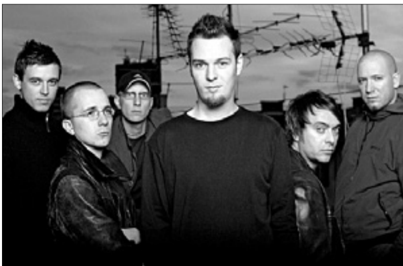
Tudi skupina Siddharta bo med številnimi gosti Schengenfesta

V Vinici, ob reki Kolpi na meji med Slovenijo in Hrvaško, bo tudi letos potekal tridnevni glasbeni festival Schengenfest '12. Gre za peto izvedbo tovrstnega festivala, letos pa se bodo na odru izmenjevali res vrhunski glasbeniki, ki bodo popestrili večere številnih obiskovalcev in dokazujejo stalno rast kakovosti Schengenfesta.