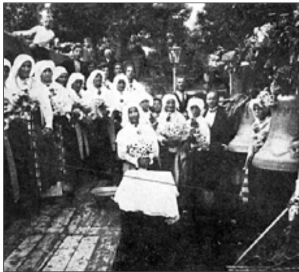
Naslovnica (zgoraj levo) in tri fotografije iz bogato fotografsko opremljene knjige