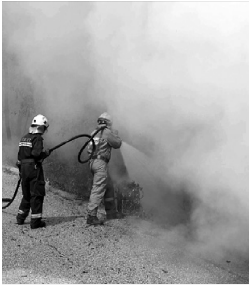
Z ognjem se je včeraj spopadlo 75 gasilcev, pomagal jim je helikopter

Včeraj požara še niso obvladali - Odjeknile so tri eksplozije, na srečo brez posledic