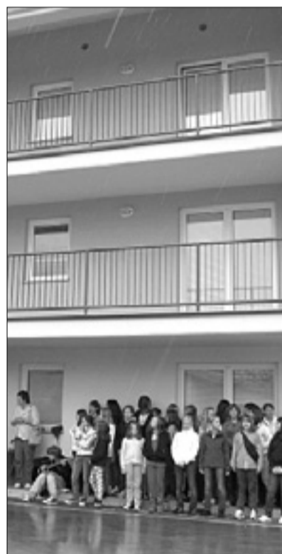
Neprofitna stanovanja v Šempasu K.M.

Letošnji podatki o številu deložacij so – glede na dve do triletno trajanje postopka – torej odraz situacije izpred dveh, treh let. Zato je pričakovati, da se bodo v velikem številu dogajale tudi v bodoče. »Bojim se, da ja,« pritrjuje Lebanova. Na njihovi čakalni listi za neprofitna stanovanja je tre-