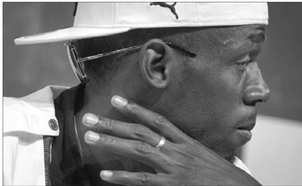
Finale na 100 m, na katerem je Usain Bolt nesporen favorit, bo že v nedeljo ob 22.50 po našem času