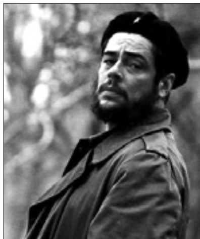
0.00 Film: Che l'argentino (biogr.)

7.00 7.55 Aktualno: Omnibus 7.30 Dnevnik 9.45 L'aria che tira - Il diario 11.00 Otto e mezzo 11.40 Film: Un tocco di classe (kom.) 13.30 Dnevnik 14.00 Kronika 14.40 Film: Anna dei miracoli (dram.) 16.40 Serija: The District 18.10 Serija: L'ispettore Barnaby 20.00 Dnevnik 20.30 Crozza nel Paese delle Meraviglie 21.10 La Gabbia