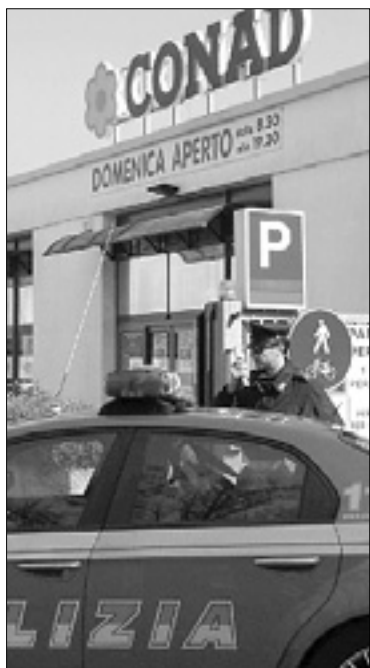
Policija pred marketom