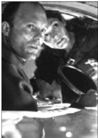
23.20 Film: Brezno

6.50 Risanke in otroške serije 8.15 14.00 Serija: Kako sem spoznal vajino mamo 8.40 19.00 Nan.: Veliki pokovci 9.10 14.30 Serija: Alarm za Kobro 11 10.05 15.25 Serija: Nikita 10.55 Astro TV 12.25 Tv prodaja 12.55 Serija: Živali na delu 13.30 19.25 Serija: Vzgoja za začetnike 16.15 Film: Laži in šepetanja 18.00 19.55 Svet 20.05 Film: Batman - Na začetku 22.30 Nad.: Grimm