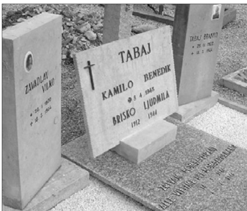
Obnovljeni nagrobni spomenik v Štandrežu

nega društva Stanko Vuk Miren-Orehovlje se bodo ob 70-letnici bombardiranja in požiga vasi spomnili žrtev v torek, 18. marca, ob 18. uri ob spomeniku v mirenskem parku. Program bodo oblikovali društvo Stanko Vuk, učenci mirenske osnovne šole, vokalna skupina Chorus97 in pevski zbor društva žena Miren; slavnostni govornik bo Gabrijel Devetak. Ob 19. uri bo v mirenski cerkvi še maša v spomin na žrtve bombardiranja. (dr)