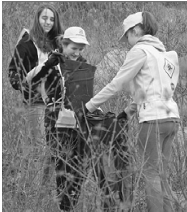
Mladi udeleženci in zbiranje odpadkov