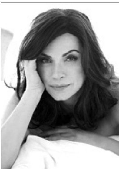
22.55 Serija: The Good Wife 23.55 Razza Umana

6.45 Risanke 8.05 Sorgente di vita 8.35 Nad.: Desperate Housewives 10.00 Rubrike 11.00 I fatti vostri 13.00 Dnevnik in rubrike 14.00 Detto fatto 16.15 Serija: Cold Case - Delitti irrisolti 17.45 Dnevnik in šport 18.45 Serija: Squadra Speciale Cobra 11 20.30 23.40 Dnevnik 21.00 Nan.: LOL - Tutto da ridere 21.10 Serija: Rex