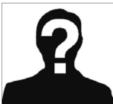
Kaj pa Doberdob?

la, da želi pri oblikovanju volilnega programa prisluhniti sugestijam občanov, zato pa namerava prirediti niz javnih tematskih večerov. Prvo srečanje bo namenjeno vprašanju okolja (npr. kako preprečiti divje odlaganje odpadkov v naravo ali kako se dodatno spodbuditi ločeno zbiranje odpadkov), sociale (npr. kako lahko občina pomaga socialno ogroženim družinam) in spoštovanja zakona 38 oz. vidne dvojezičnosti (npr. je vidna dvojezičnost dovolj ali primerno »vidna«); prirejejo ga v sredo, 19. marca, ob 20.30, na sedežu društva Skala v Gabrjah. (dr)