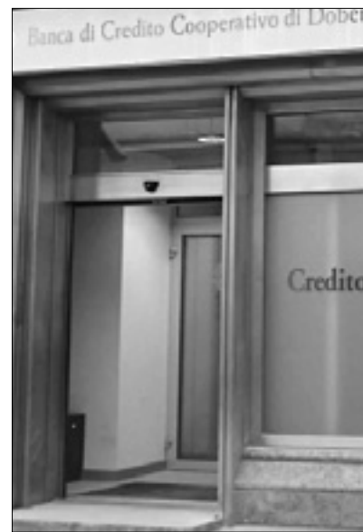
Zadruga banka v Gorici