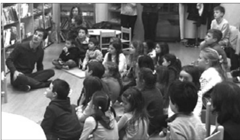
Vesele ure za mlade bralce Narodne in študijske knjižnice