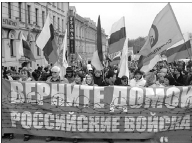
Demonstracija v Moskvi proti ruskemu vmešavanju v Ukrajini