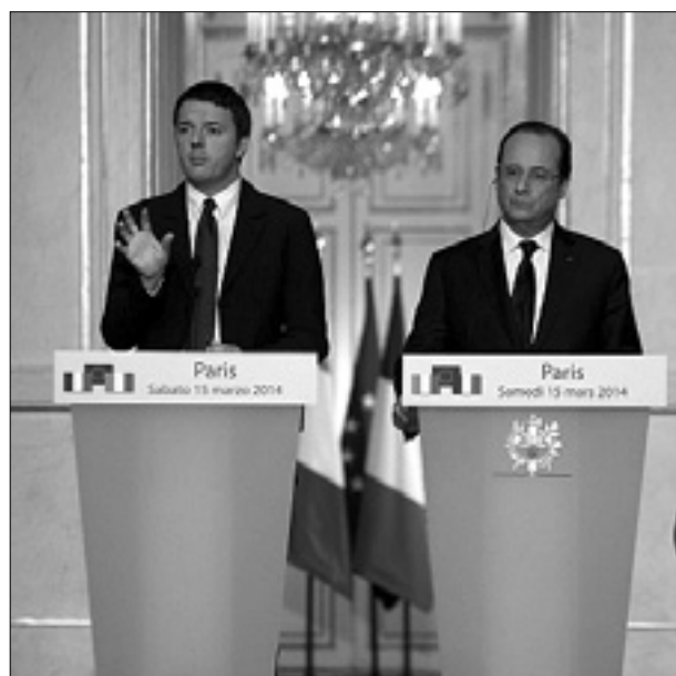
Renzi in Hollande med tiskovno konferenco

PARIZ - Francoski predsednik Francois Hollande in predsednik italijanske vlade Matteo Renzi nameravata »spremeniti Evropo«. Skupaj bosta pritisnila na nemško kanclerko Angela Merkel: Italija in Francija spoštujeta pakt stabilnosti in mednarodne pogodbe, pravita, toda nujen je zasuk, ker je potrebno spodbujati rast in zaposlovanje.