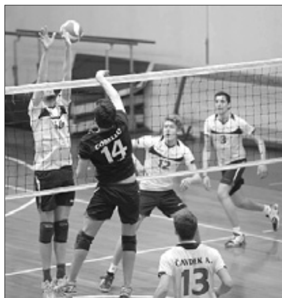
Cobello (Soča) med napadom na sinočnji tekmi proti Olympii

Potek posameznih nizov je bil dokaj podoben. Ekipi sta si bili enakovredni vse nekje do 10. točke, ko so Terpin in soigralci le izkoristili svoj napadalni potencial in si priigrali primerno razliko v točkah za breskrbno osvojitve treh potrebnih nizov. Trener Marchesini, ki je v uvodu vseh treh nizov zaupal diagonalno podajalec-korektor Černicu in Lavrenčiču, je o sredi niza zamenjal s Hledetom in Vogričem. Na strani gostov je trener Markič poslal na igrišče vse razpoložljive in vsi so se tudi vpisali v seznam osvajačev točk. Poleg že omenjenega dobrega serviranja velja poudariti tudi nekaj dobro postavljenih blokov, kar da slutiti, da so nekateri mladinci na dobri poti, da se lahko razvijejo v dobre odbojkarje. Še kar številna publika je ob koncu srečanja s toplim aplavzom pozdravila odbojkarje obeh ekip. (J.P.)