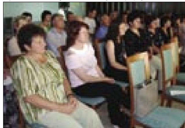
Pogled na del udeležencev Okrogle mize o Perspektivah porabskega narodnostnega šolstva.

Sicer pa so se udeleženci seminarja – v Lendavo jih je prišlo deset, vzgojiteljice, učiteljice in učitelj – seznanili tudi s pomembno