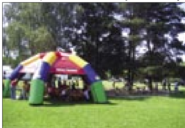
Ustvarjalni kotički na obširnih igriščih ob Vrtecu Radenski mehurčki

Vrtec v Radencih - Radenski mehurčki (10 igralnic, telovadnica in obširna zunanja igrišča) - praznuje letos 60-letnico svojega obstoja. Rojstni dan te vzgojno-varstvene ustanove so proslavili 15. junija popoldne. V sodelovanju z Društvom