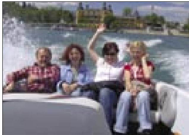
Del članov pevskega zbora na Vrbskem jezeru

Hemmaberg). Na goro sv. Heme so že v starom veki romali lidgé, steri so iskali smiseu svojoga življenja. Arheologuške so vōskopali pet cerkva, štera nam kažejo duhovno moč toga kraja.