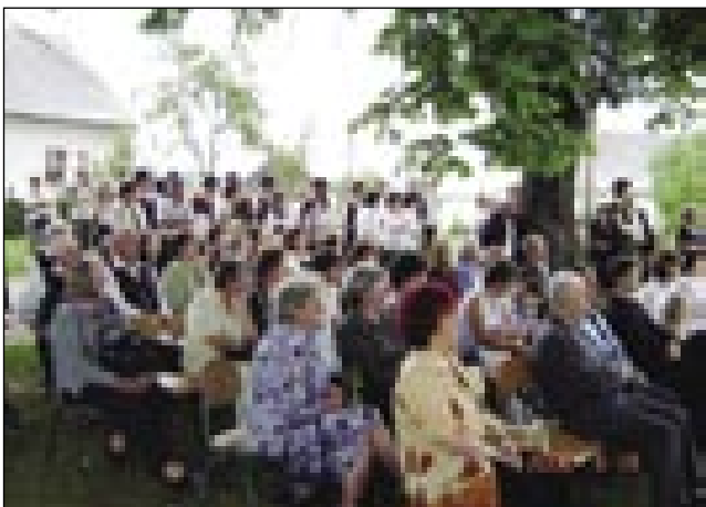
Gledalci kulturnoga programa

Kak plamén, je úšo glas od človeka, do človeka »Si čójo, ka so gospaуда Szabolcsa vkraj djali...« Kak je tau lüstvo vzelo, kak djemlé, o tejm mo pisali v naslednji novinaj Porabje. Po procesiji pa svetoj meši je