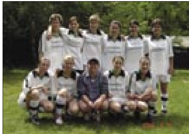
Ženska nogometna ekipa

»Lanjsko leto smo se oprvim leko srečali pri svetoj meši v Bogojini z njimi. Od nji smo zvedli, ka so 1941. leta v šte-