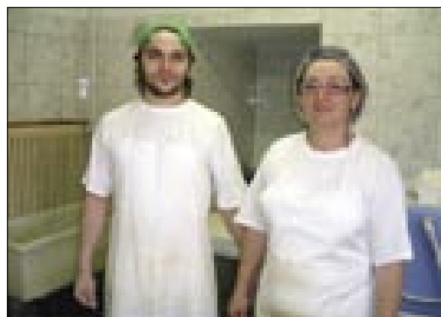
S sinaum, steri je slaščičar

Sezona se nam po vüzmi zača pa cejlak do decembra traja. Te odimo kaulak pa odavlammo svoje izdelke na štandaj. Največ odimo tū po Prekmurji, pozimi pa malo dala, do Lenarta.«