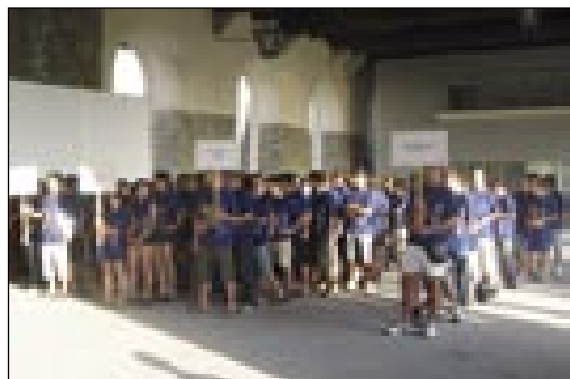
Med nogometnimi ekipami je zmagala porabska. Od Nogometne zveze Slovenije so dobili športno opremo