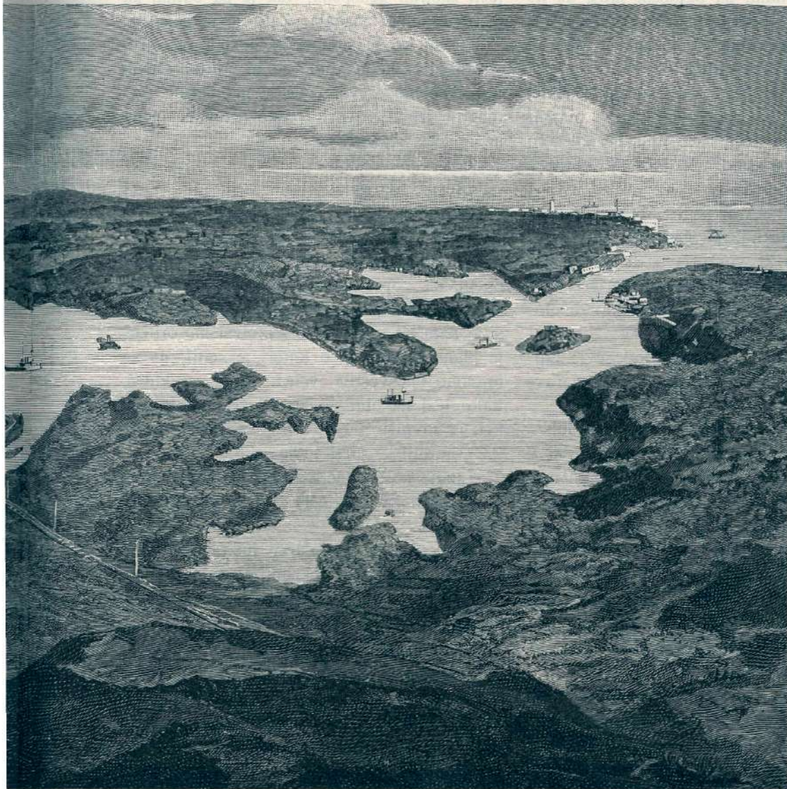
Jago na Kubi.

zvršilo zadnji hip: „Torej sta vendar šla? Bog ju nesi! In ta Oskar misli, da je nekaj, pa se je dal rabiti njemu za — kleščce. Pa še pravi: Za tvojo srečo mi je! Lep mož to! Ha, ha, in še soprog! Bog me varuj! Njemu da bi bila igrača, zabava — sužnja njegovim