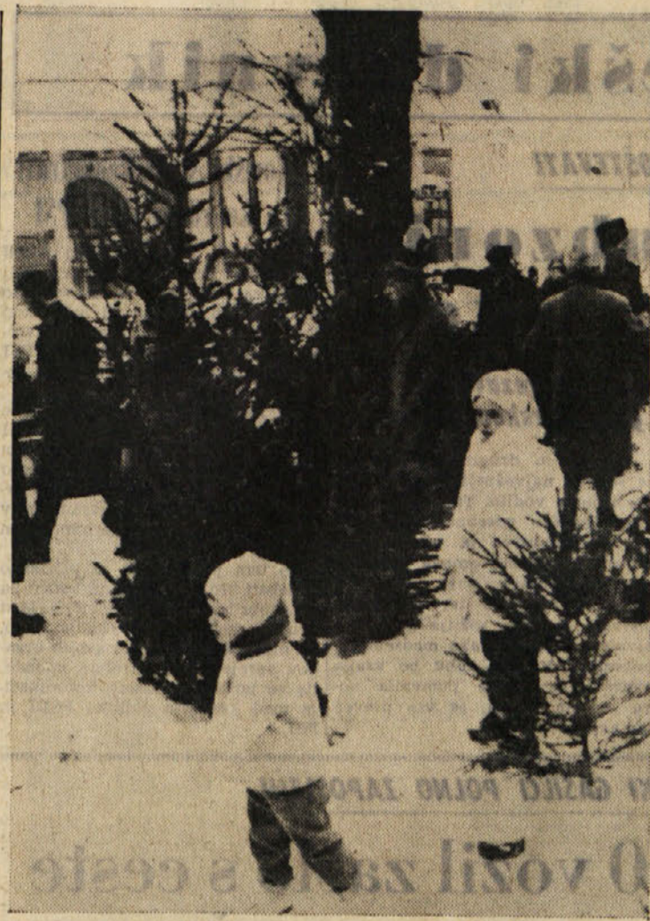
V teh dneh je ponekod v Ljubljani zelo živo: Otroci in njih starši izbirajo pravno drevesce za novoletno jelko

Nedavno je bila pred generalnim svetom seinskega departmana obširna razprava o tem. Neki občinski svetnik je odločno zahteval ustanovitev mladinskih gledališč, da bi se pro-