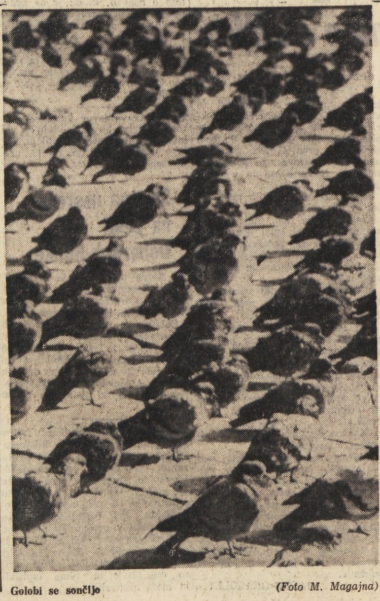
Golobi se sončijo

Sl. Ru. V FILMSKIH KROŽKIH Danes premiera filma «La villeggiatura» v Tržaškem kinoforumu Danes, v četrtek, 25. oktobra ob 20.30 bo v kinu Astra v Rožanu Tržaški kinoforum začel sezono 1973-74. Film, s katerim se začena bogata sezona, je Marca Leta film «La villeggiatura», v katerem igrajo Adolfo Celi, Adalberto Maria Merli, Milena Vukotić, John Steiner. Gre za tržaško premiero enega najboljših filmov, ki so pred kratkim nastopili na beneških dnevnih italijanskega filma. Pripoveduje zgodbo, v kateri se odkriva vsa struktura oblasti v fašističnem obdobju (in morda tudi danes).