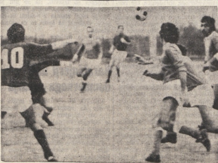
V. 4. kola 2. amaterske lige je Primorje moralo kloniti premoci Audaxa

Na zasedanju FIBA so med drugim sklenili tudi uvesti novost v pravilnik košarkarske igre: ekipa, ki bo v vsakem polčasu zbrala deset osebnih ali tehničnih napak skupaj, bo za vsako nadaljnjo napako kaznovana z dvema prostima streloma.