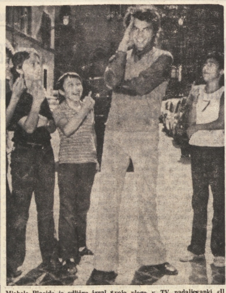
Michele Placido je odlično igral svojo vlogo v TV nadaljevanju «Il picciotto», ki je bila nedavno na sporedu italijanske TV. Na sliki ga vidimo, ko se igra s svojimi mladimi prijatelji

Vest, da so štiri postaje še pred začetkom delovanja tega teleskopa ujele signale, za katere se domneva, da izhajajo od neke tuje civilizacije, prinaša novo optimizem. Morebitna umsko razvita bitja v vesolju so torej bliže kot se je domnevalo, ko so domnevali sovjetski znanstveniki, ki so delali načrte za novi teleskop na Kavkazu. Ta teleskop bi namreč moral predrži še globlje v vesolje. Sovjetski znanstveniki z Nikolajem Kardasovim na čelu domneva, da so se civilizacije, ki so bolj razvite od naše, že združile v nekem regiju kozmosa in da je treba torej radijski teleskop usmeriti v tej smeri. Kje naj bi to mesto bilo, ni znano. Toda po vesti, ki smo jo objavili v začetku, je verjetno, da so sovjetski znanstveniki po svojih računih že vsaj približno določili