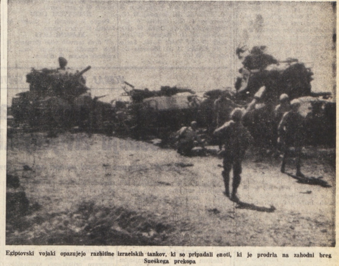
Egiptovski vojniki opazujejo razbitine izraelskih tankov, ki so pripadali enoti, ki je prodira na zahodni breg Sueškega prekopa