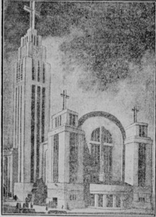
Prvo jekleno cerkev na Dunaju bodo v kratkem začeli graditi. Načrte je napravil avstrijski arhitekt Prutscher. Cerkev bo vsa iz jekla.

rajo od časa do časa sanitetne kolone z zdravili, trežaji in zdravnikom. Film kaže med drugim tudi prihod take kolone v vas. Najprej se prikažejo nosači z zdravili, nato bolniški strežaji in naposled zdravnik. Na prostoru sredi vasi je že zbrana množica bolnikov. V nekaj minutah začne potujoča zdravstvena postaja posloovati. Domorođce najprej razdele po spolu, starosti in krajih, kjer so doma. Nato se vrši isti postopek kakor v Ayosu. Zdravnik napiše vsem recepte, kako naj