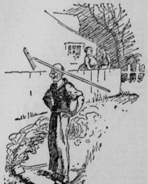
»Samo to bi rad vedel, kako da vsakdo takoj opazi, da sem levičen knjigovodja.«

»O, potem pa oprostite, prosim,« pravi policist in spusti avtomobil naprej.