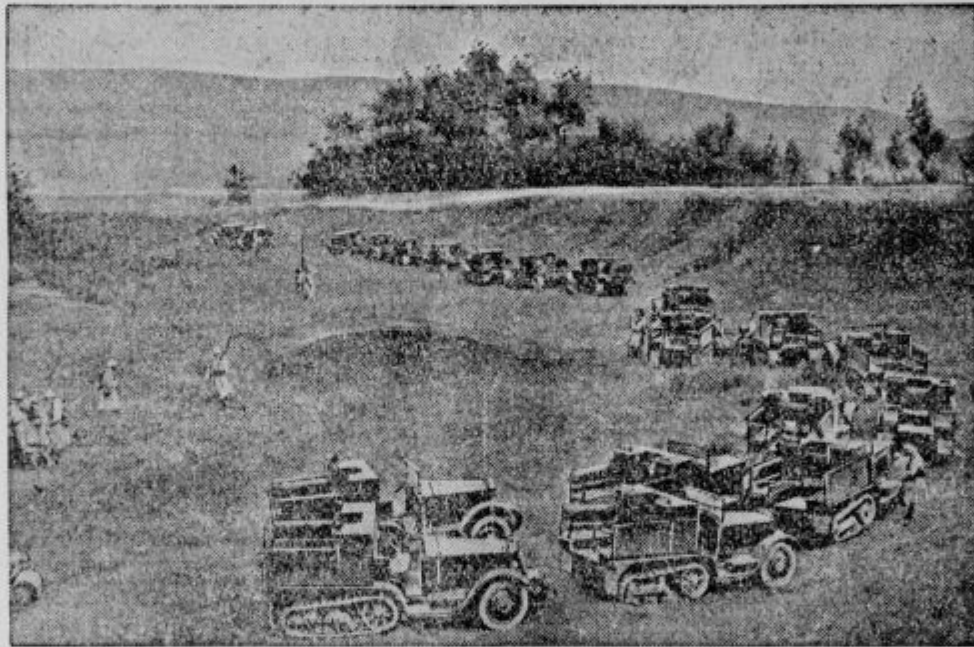
Francoski jesenski manevri, katerih so se udeležile tri divizije z najmodernejšimi tehničnimi opremami, so se vršili letos na ozemlju bitke ob Marni skoro natančno 17 let po strašni borbi. Na sliki vidimo oddelek modernih tankov.

Zelo zanimiv je nadalje oni del filma, ki kaže, kako se Francozi bore proti strašni bolezni. V Ayosu so opremili veliko bolniško postajo. V filmu vidimo, kako stoji dolga vrsta domačinov pred poslopjem. Zdravnik poišče najprej oteklo mesto, kjer je bolnika pičila muha cece. Nato predere oteklino in tekočino,