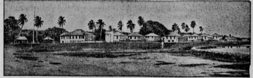
Strašen orkan v Srednji Ameriki je skoro popolnoma porušil glavno mesto angleškega Hondurasa Belize (spodnja slika). Tudi mesto San Juan na Portorico (zgornja slika) je silno poškodovano.