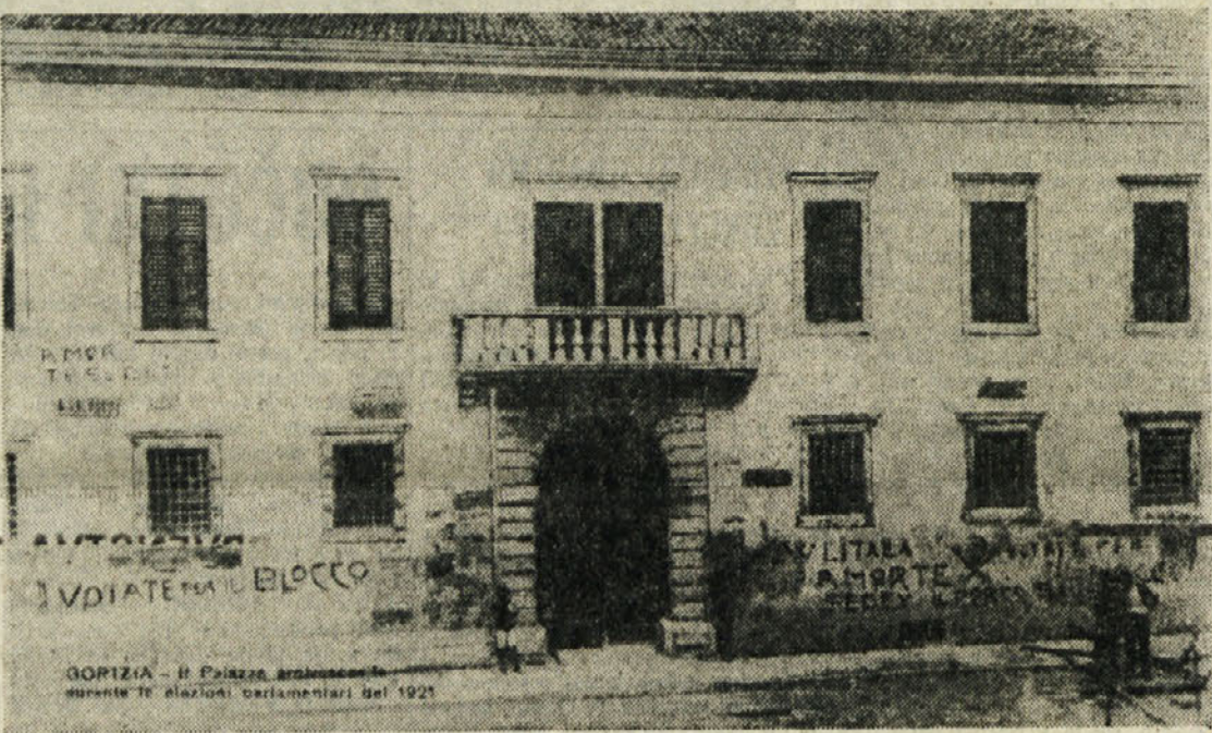
Goriški fašisti in ne le fašisti so takole dajali duška svojemu besu: na zidove nadškofjskega sedeža so napisali «Smrt Sedeju» in «Smrt Sedeju, svinji SHS», torej smrt Jugoslavni svinji, kajti Jugoslavija je bila tedaj «Kraljevina Srbov, Hrvatov in Slovencev». Besi proti Sedeju je bil torej tudi bes proti Slovincem

Mesec dni pred smrtjo se je na pritisk Vatikana in fašistične vlade umaknil s svojega položaja - Zakaj so slovenski in Slovencem naklonjeni škofje tedaj odstopali