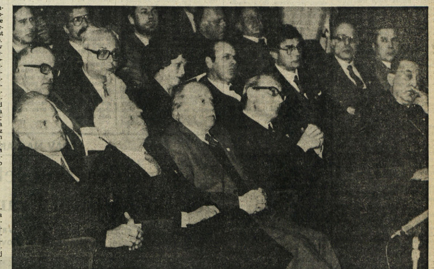
Sinočnje slovesnosti ob odprtju novega Kulturnega doma so se udeležili tudi številni ugledni gosti

Kakor nismo mogli sami zgraditi tega doma, ne bomo mogli sami v današnjih razmerah vzdrževati visokih stroškov vodenja in vzdrževanja. Ker predstavlja, poleg vsega, ta dom pomembno pridobitev za gospodarstvo in dosledno odklanjanje naše udeležbe v politiki s prostorsko objektivno pomena, da je še živa težnja, da bi se naša materialna odvisnost povečala. Odvisnost pa po kratki poti vodi v asimilacijo. Naša narodnostna skupnost je v zadnjem času predmet vedno večjega zanimanja. Naša zaščita je obvezen predmet razgovorov med predstavniki Jugoslavije in Italije: deželni svet Furlanije - Julijske krajine je naša vprašanja podrobno obravnaval in se obvezal, da bo pozitivno posredoval pri vladi; predsednik vlade Spadolini je se pred parlamentom obvezal, da bo vlada izdelala sintezo raznih predlogov; emota slovenska delegacija je na srečanju s predsednikom vlade, z zunanjima ministroma Colombom in Vrhovcem, s tajnikoma KD Piccolijem in KPI Berlinguerjem postavila zahtevo, naj pride takoj do razprave v parlamentu o zakonu za zaščito naše manjšine.