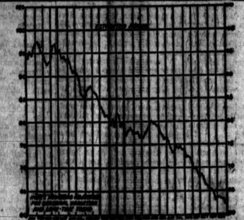
The New York Times je objavil gorajj seznam industrijske produkcije v Ameriki v zadnjih dveh letih. Kakor je videti, gre produkcija navzdol.

To sem objavil zato, ker me je že več darovalcev vprašalo, "Saj si vendar več nabral ko 226 Din, in to je vknjiženo v raču- nih, potrjenih od odbora na Vrhniki." Če kdo želi videti resni- ca in izdatke ter preostanek za spomenik Cankarju na Vrhniki in koliko je kateri daroval,