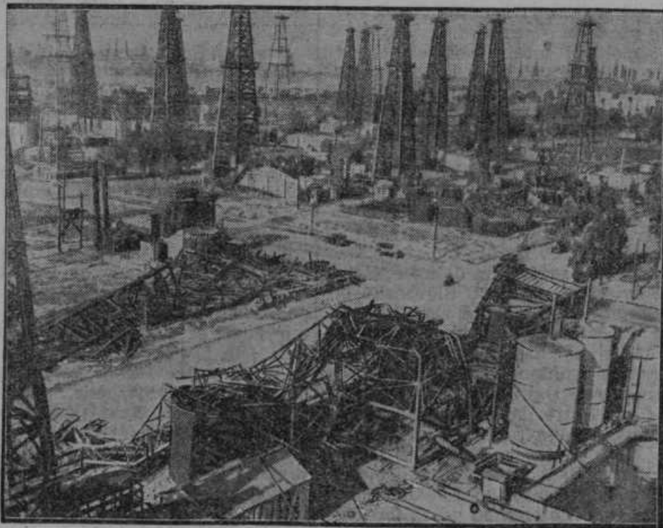
V južni Kaliforniji, v bližini mesta Los Angeles je divjal strahovit tornado (vilhar), ki je podrl mnogo stolpov za sesanje olja iz zemlje.