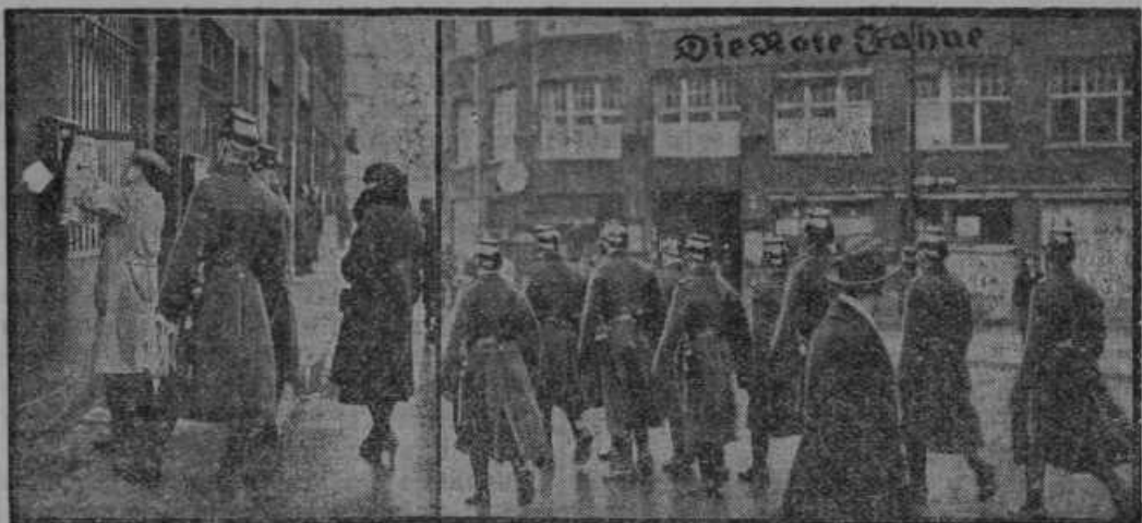
Hitlerjeva nemška vlada se je lotila komunistov. Na sliki vidimo policijo v Berlinu, ko pleni komunistično glasilo »Rote Fahne«. Policija je zasedla tudi komunistično glasilo.

Pod tem naslovom izdaje Prosvečna zveza v Mariboru zbirko kratkih in poljudno pisanih poučnih razprav in sestav, ki prav dobro služijo društvom in posameznikom v izobraževalne svrhe. Doslej je izšlo 12 zvezkov te zbirke, ki vsebujejo obilno tvarine za samoizobražbo in za predavanja v prosvetnih organizacijah. Začela se je druga seri-