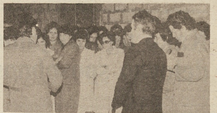
Oddelek emajlirnice tozd Štedilniki Gorenje

V organizacijah združenega dela naj bi torej proslavili ta dan tako, kot si želimo in prizadevamo, da bi potekala vsa naša praznovanja -- delovno in tovariško.